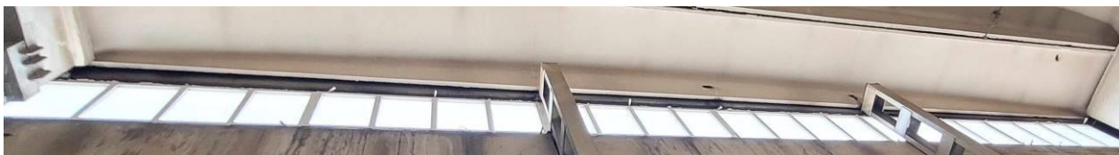
Nawa nr 4