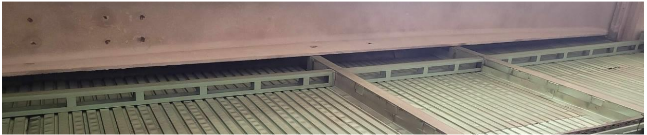
Nawa nr 1