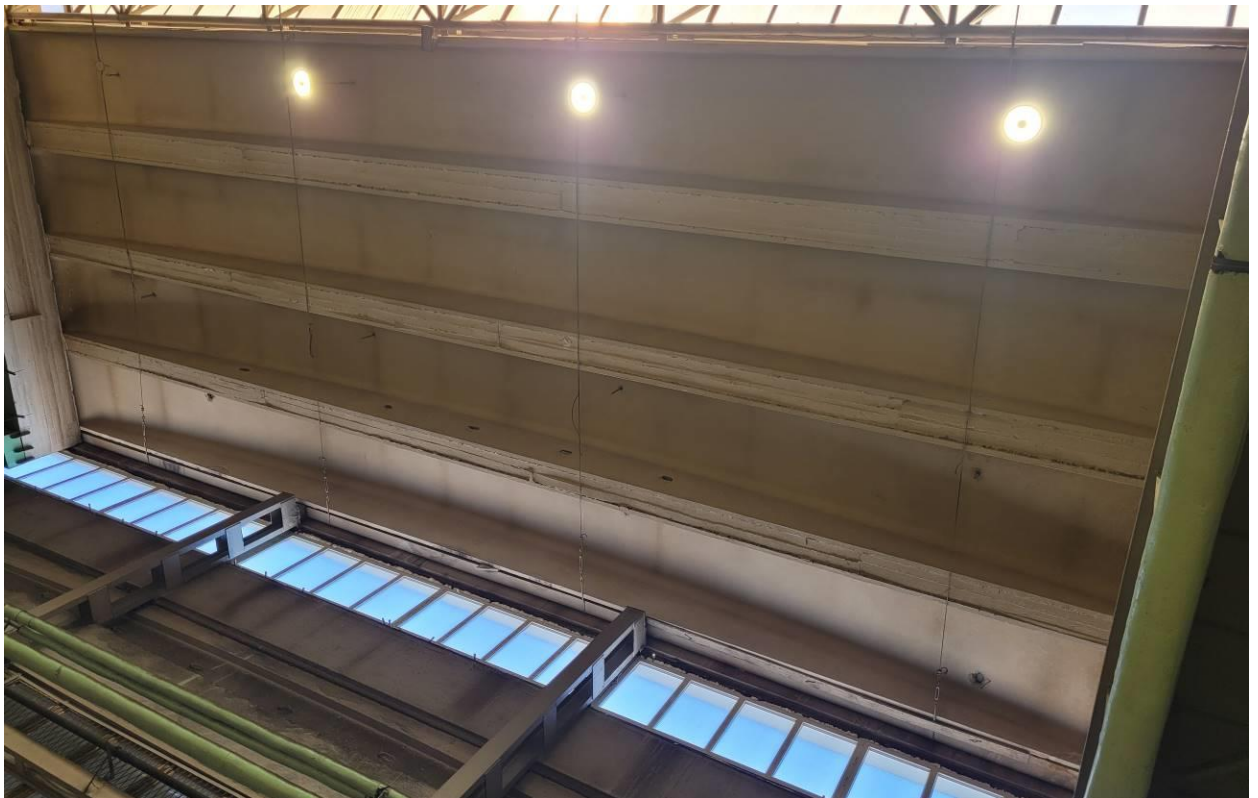
Nawa nr 2