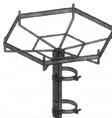
Z zestawem do montażu na żerdzi A-owej (klinKS-15)