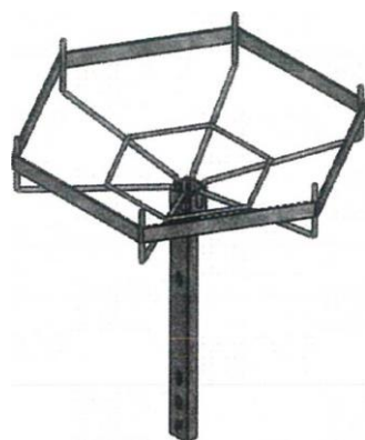
Z zestawem do montażu na żerdzi ŻN