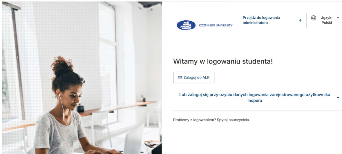
Rysunek nr 2. Strona logowania do systemu egzaminacyjnego Inspera

prezentacji instrukcji i komunikatów, a także przekazywania wyników/ocen oraz informacji zwrotnej.