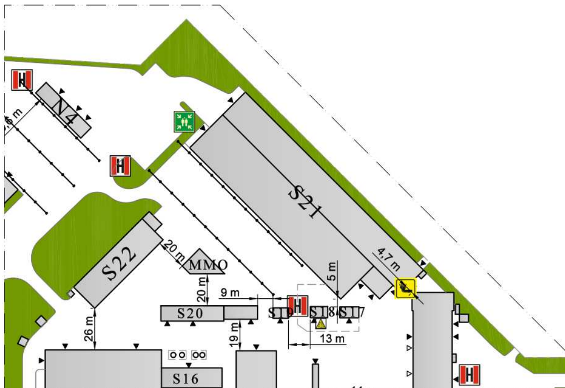
Rys. 1. Schemat rozmieszczenia hydrantów zewnętrznych

Zapotrzebowanie w wodę do zewnętrznego gaszenia pożaru zapewnione poprzez istniejące hydranty na działce inwestora i działkach sąsiednich. Hydrant zlokalizowany najbliżej istniejącego budynku znajduje się w odległości 20m, a pozostałe 25m, 48m, 69m.