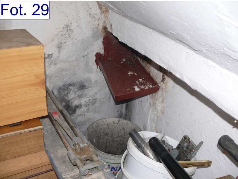
Zaciek w lokalu przy narożniku "B" z kamienicą przy ul. Mickiewicza 4. Nieszczelne koryto przy ujściu do rury spustowej. Prawdopodobieństwo korozji biologicznej płatwi stopowej.