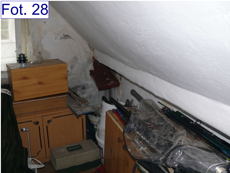
Zaciek w lokalu przy narożniku "B" z kamienicą przy ul. Mickiewicza 4. Nieszczelne koryto przy ujściu do rury spustowej. Prawdopodobieństwo korozji biologicznej płatwi stopowej.