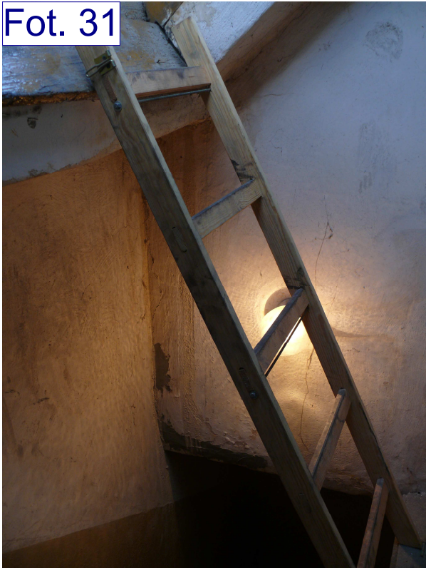
Zaciek przy istn. wyłazie dachowym przy kamienicy ul. Mickiewicza 2. Nieszczelne koryto.