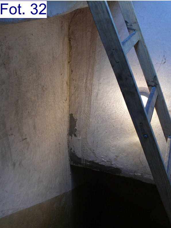
Zaciek przy istn. wyłazie dachowym przy kamienicy ul. Mickiewicza 2. Nieszczelne koryto.