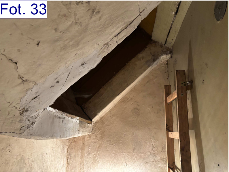
Zaciek przy istn. wyłazie dachowym przy kamienicy ul. Mickiewicza 2. Nieszczelne koryto.