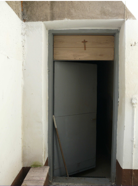
Drzwi zewnętrzne do wymiany.

Uwaga : -w przypadku zastosowania tynków i farb elewacyjnych innych producentów kolor zamienników należy dobrać na podstawie palety kolorów, nie dobierać ich kierując się kolorami pokazanymi na rysunkach elewacji (ze względu na możliwe przekłamania drukarki).