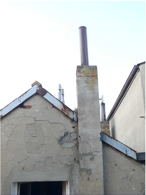
Spękany tynk do skucia. Komin do przemurowania.