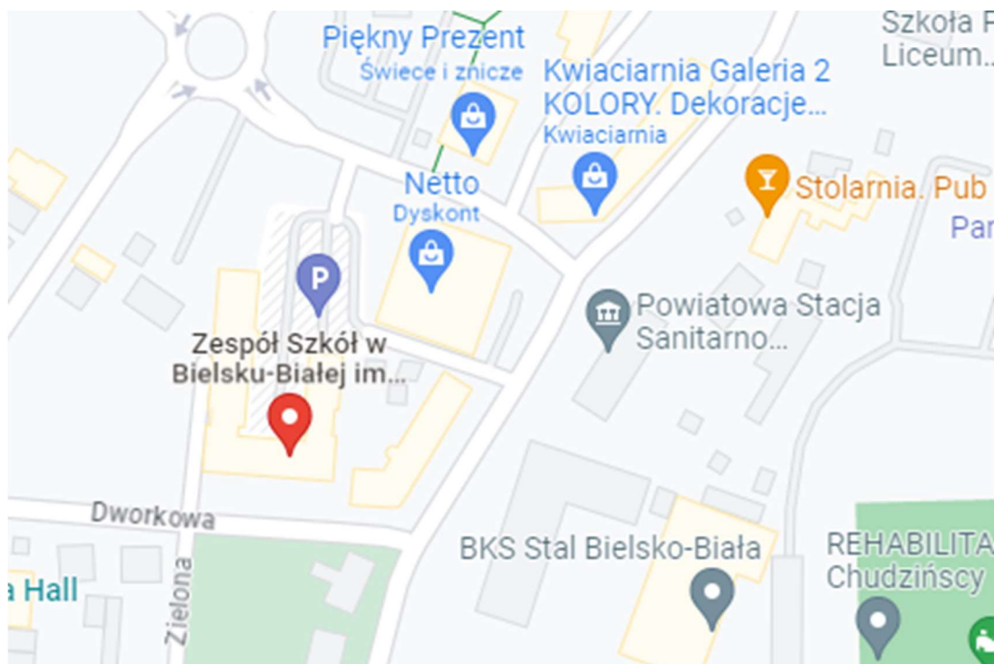
Rysunek 1. Lokalizacja inwestycji – Zespół Szkół w Bielsku-Białej Zakładu Doskonalenia Zawodowego

województwo śląskie powiat bielski gmina Miasto Bielsko-Biała adres: ul. Dworkowa 5, 43-300 Bielsko-Biała nr działki, obręb 341/29; 0002 Bielsko-Biała