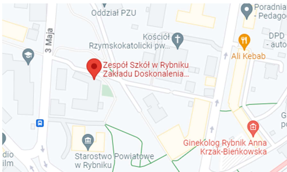
Rysunek 1. Lokalizacja inwestycji – Zespół Szkół w Rybniku Zakładu Doskonalenia Zawodowego

województwo śląskie powiat rybnicki gmina Miasto Rybnik adres: ul. Klasztorna 14, 44-200 Rybnik nr działki, obręb 4502/226; 0089 Rybnik