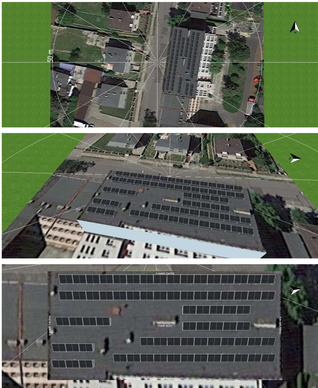
Fotografia 1. Proponowane rozmieszczenie modułów PV na dachu budynku

Proponowane rozmieszczenie modułów PV na dachu budynku.