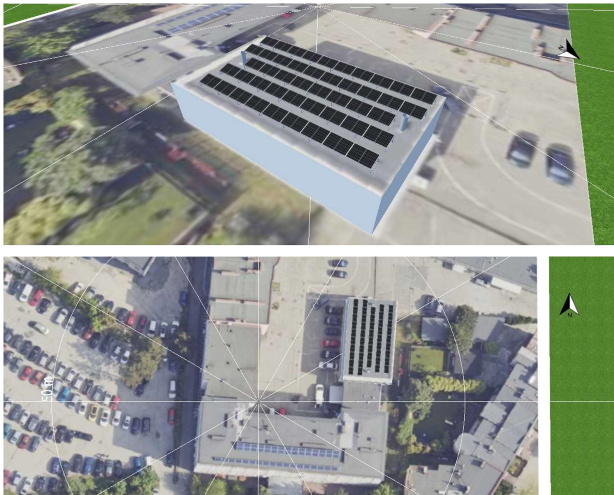
Fotografia 1. Proponowane rozmieszczenie modułów PV na dachu budynku

Proponowane rozmieszczenie modułów PV na dachu budynku.