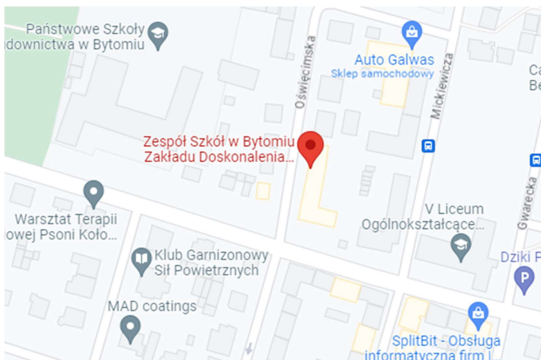
Rysunek 1. Lokalizacja inwestycji – Zespół Szkół w Bytomiu Zakładu Doskonalenia Zawodowego

województwo śląskie powiat bytomski gmina Miasto Bytom adres: ul. Powstańców Śląskich 6, 41-902 Bytom nr działki, obręb 392/25; 0002 Bytom