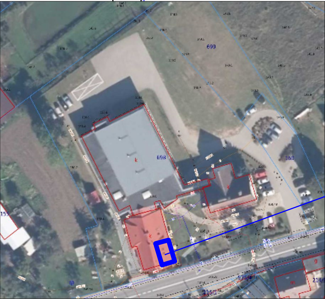
LOKALIZACJA REMONTOWANEJ SALI