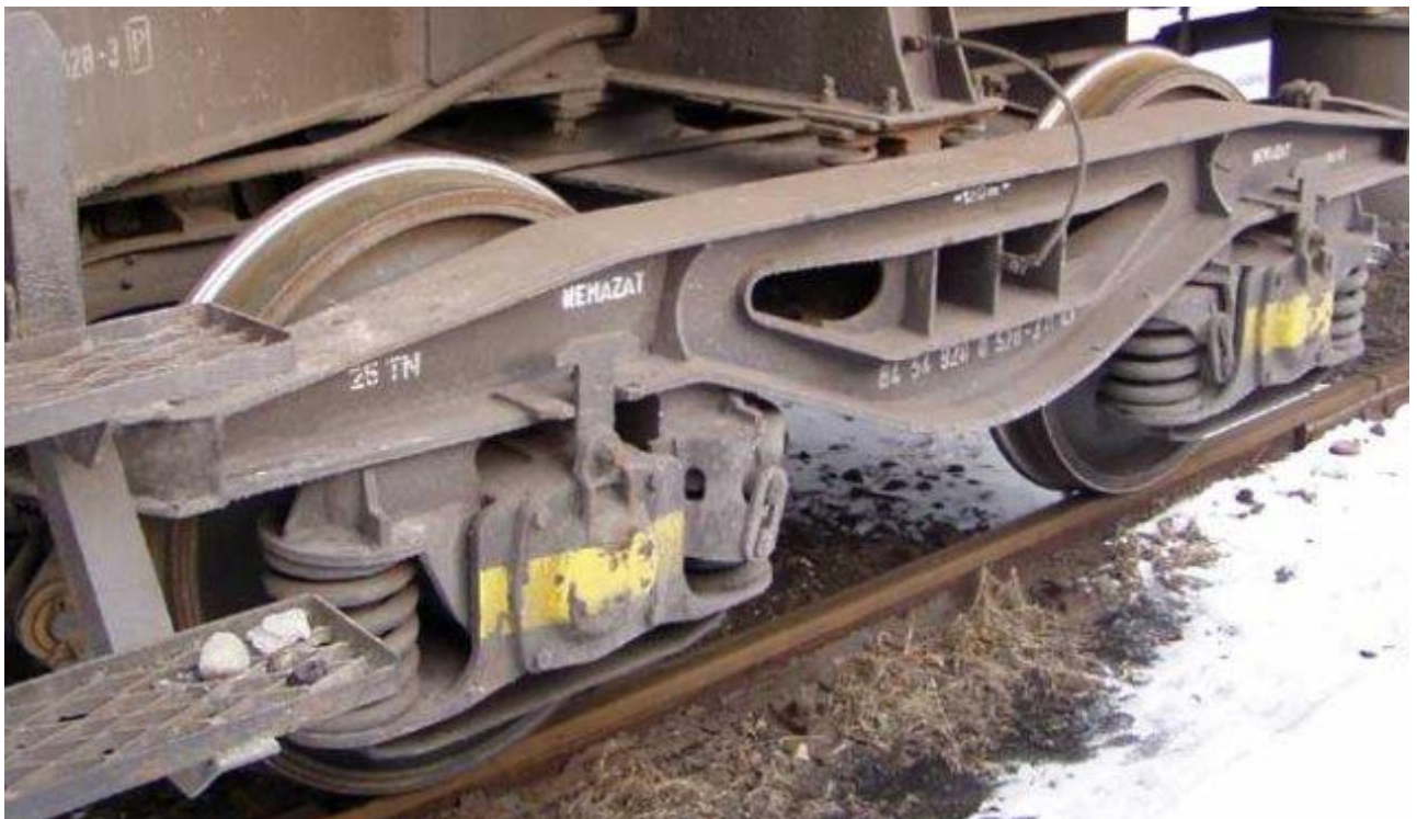
Rysunek 1. Wózek typu 25TN.