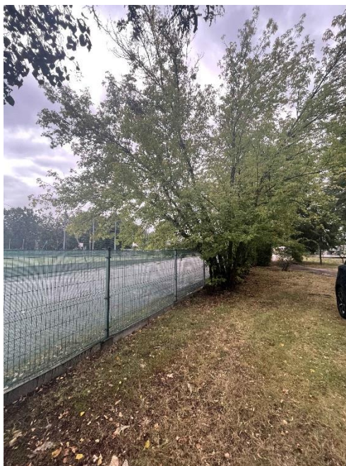
Zdjęcie 11 - 05-180 Pomiechówek, Szkolna 1