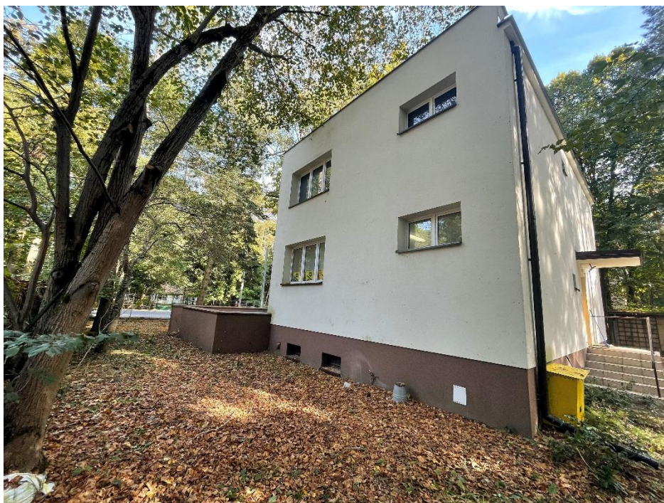
Zdjęcie 3 - 05-540 Zalesie Górne, ul. Wiekowej Sosny 58