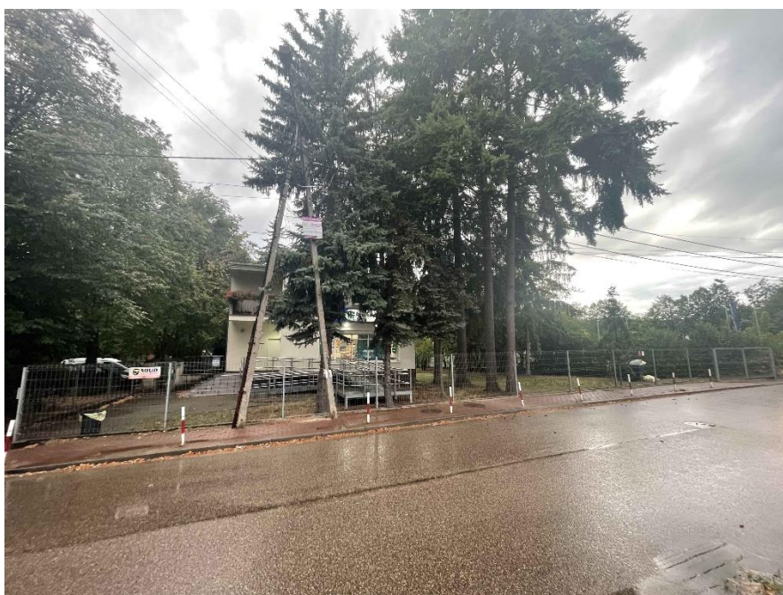
Zdjęcie 9 - 05-180 Pomiechówek, Szkolna 1