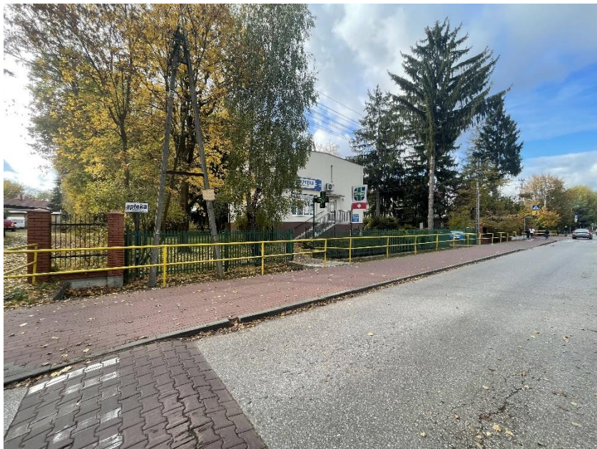
Zdjęcie 5 - 05-830 Nadarzyn, ul. Sitarskich 1