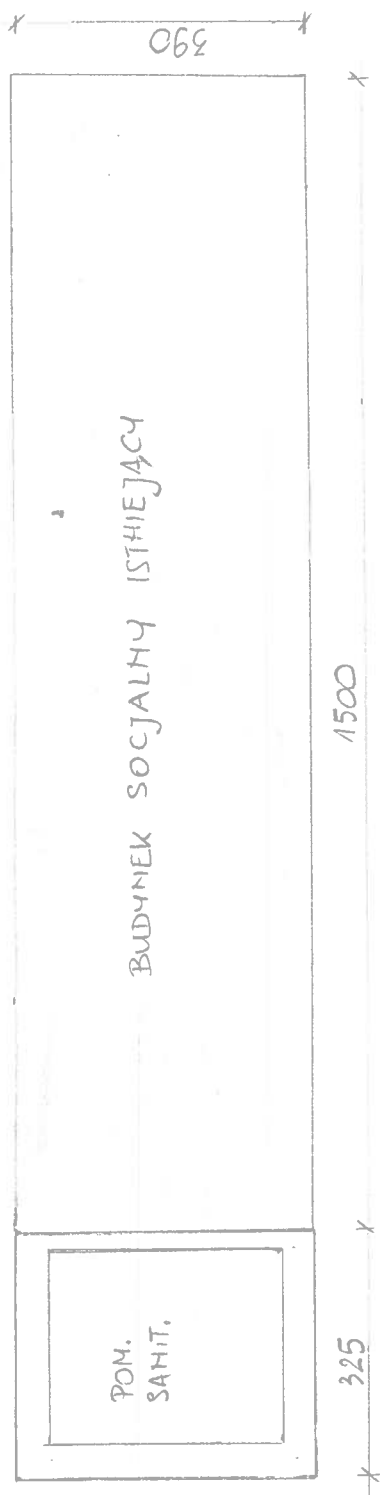
rzut rozpadowy o pomiat skalo 1:50