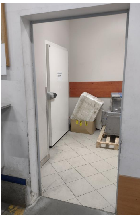
Rysunek 1 – Istniejące drzwi do pomieszczenia służy lodówki

Wymagana wizja na obiekcie w celu weryfikacji ilości oraz miejsc prowadzenia prac.