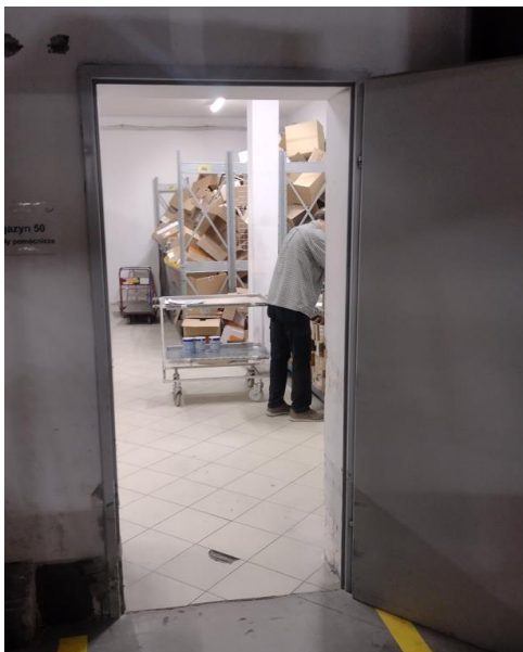
Rysunek 2 – Istniejące drzwi do pomieszczenia magazynowego wielkogabarytowego