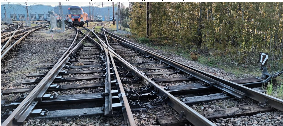
fot. 1. Rozjazd nr 245 (strona a/b)

Rozjazd nr 245 – pojedyncza wymiana podrozdajdnic (Rkpd-S49-1:6,6-R190-ss) jest zabudowany na bocznicy ZNT Kruszewiec w lokacie od 81,495 do 81,530, o kierunku 177/183 - 121b/127. Długości rozjazdu widocznego na załączonej poniżej fotografii wynosi 34,3 mb.