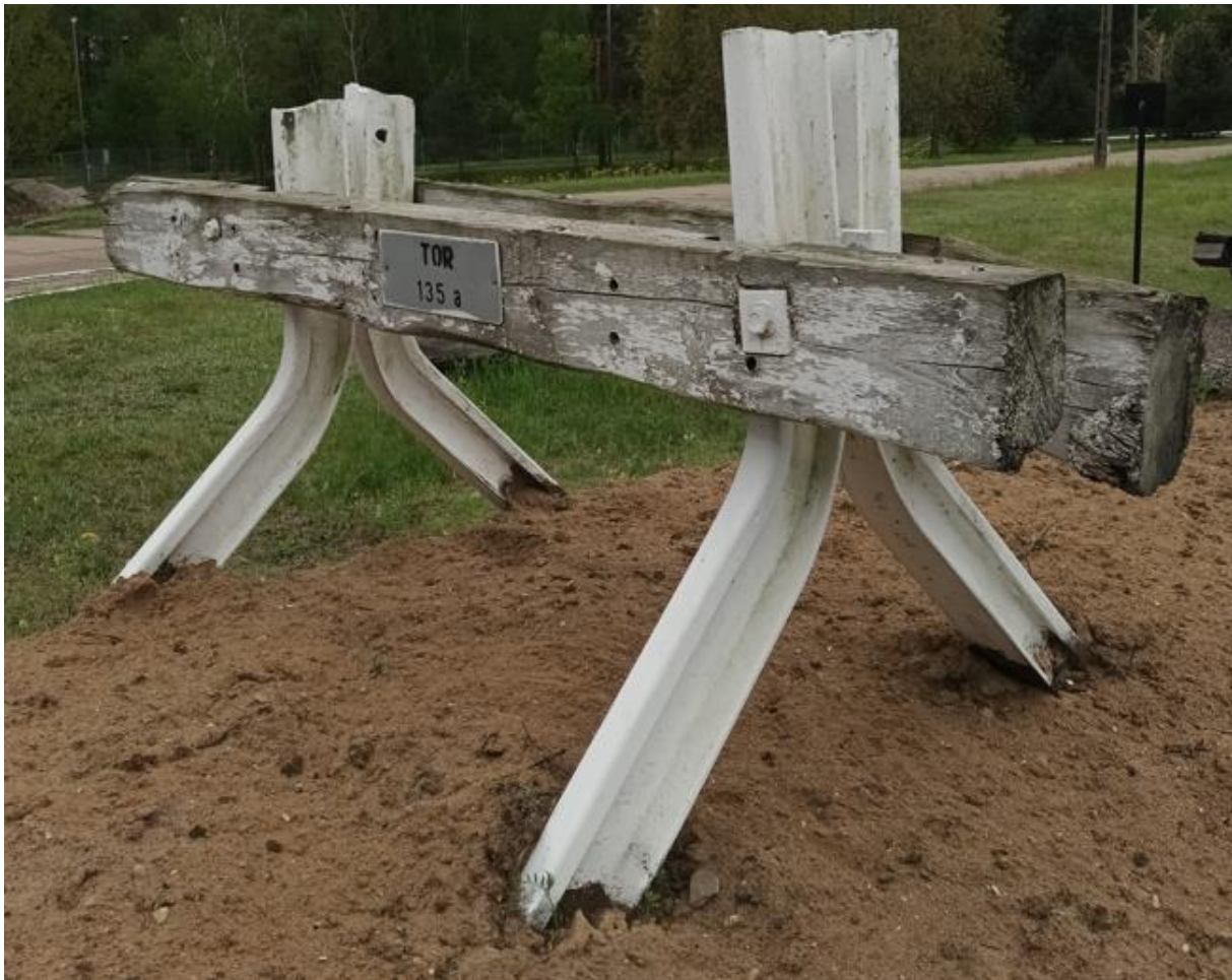
fot. 8. Tor nr 135a (Kozioł oporowy na torze nr 135a wykonany z wygiętych szyn)

Remonty torów nr 129 i nr 135a, wstawek międzyrozjazdowych o nr 245-250 (L = 8,5 mb), 250-254 (L = 11,6 mb) i nr 254-254a (L = 11,2 mb) wraz z wyżej wymienionymi odcinkami torów o nr 127 (L = 30 mb) i 131 (L = 30 mb) posiadają ten sam zakres naprawy polegający na ciągłej wymianie podsypki tłuczniowej i podkładów.