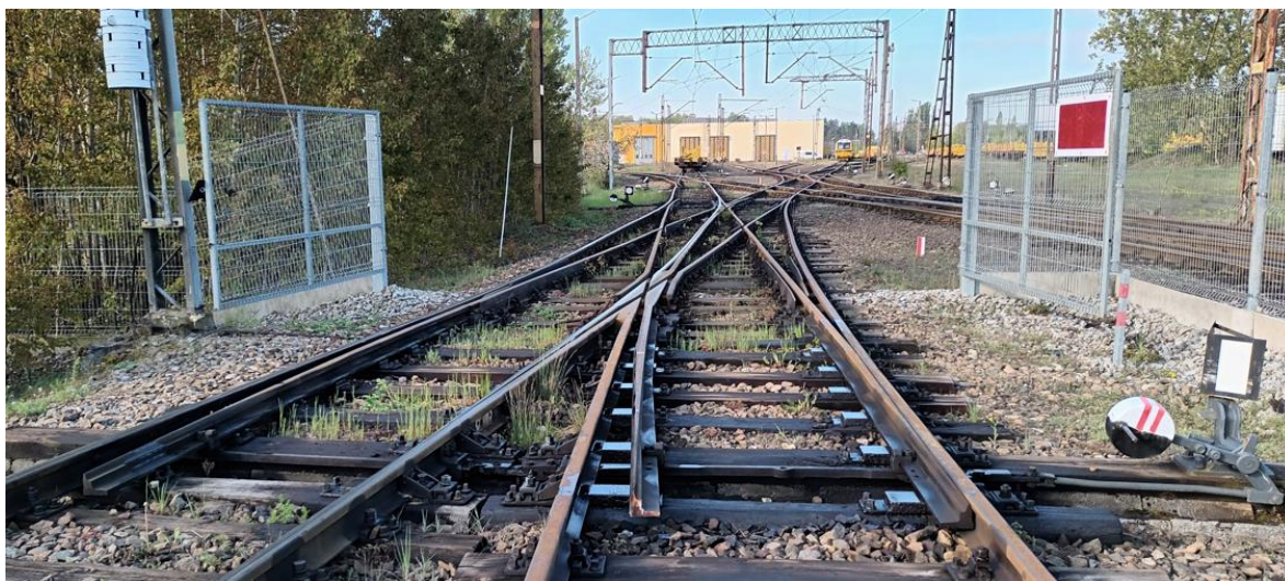
fot. 2. Rozjazd nr 245 (strona c/d)

Remont rozjazdu nr 245 obejmuje pojedynczą wymianę 24 szt. nw. podrozdajdnic: