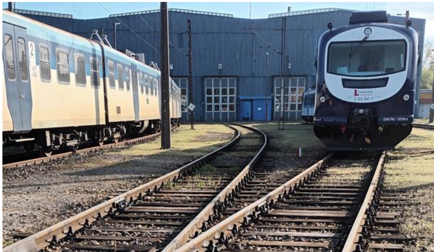
fot. 6. Tor nr 129 (strona południowa). Widoczny tor prawy ma nr 131.

Tor nr 135a (ciągła wymiana podkładów wraz z odnowieniem całego uporku i kozła oporowego) o długości ok. 133 mb jest zabudowany na boczniczy ZNT Kruszewiec pomiędzy rozjazdem nr 253 (od lokaty 81,433) i KO (do lokaty do 81,300).