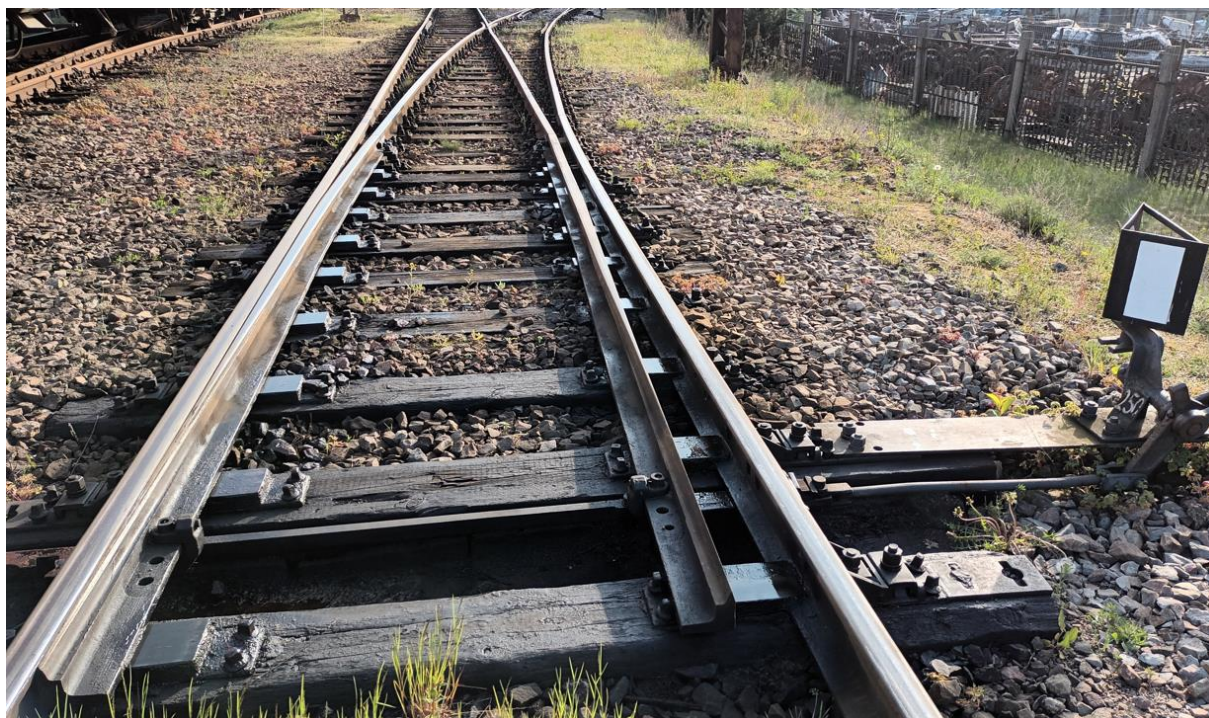
fot. 3. Rozjazd nr 250

Rozjazd nr 250 (wymiana całego doboru podroczajznic) (Rz-S49-1:6,6-R190-ss-P) jest zabudowany na bocznicy ZNT Kruszewiec w lokacie od 81,487 do 81,458, w kierunku zasadniczym na tor nr 127(P). Długości rozjazdu widocznego na załączonej poniżej fotografii wynosi 28,6 mb.