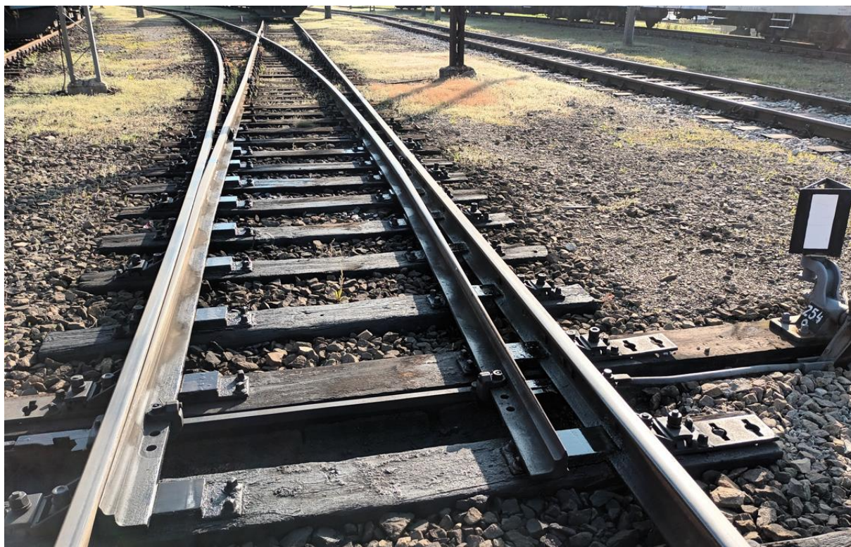
fot. 5. Rozjazd nr 254a

Rozjazd nr 254a (wymiana całego doboru podrozjazdnic) (Rz-S49-1:6,6-R190-ss-L) jest zabudowany na boczniczy ZNT Kruszewiec w lokacie od 81,382 do 81,410, w kierunku zasadniczym na tor nr 127(P). Długości rozjazdu nr 254a widocznego na załączonej poniżej fotografii wynosi 28,6 mb.