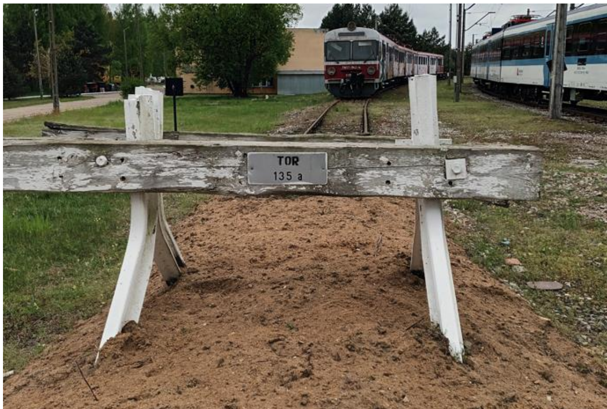
fot. 7. Tor nr 135a (strona południowa hali nr H4)

Tor nr 135a (ciągła wymiana podkładów wraz z odnowieniem całego uporku i kozła oporowego) o długości ok. 133 mb jest zabudowany na boczniczy ZNT Kruszewiec pomiędzy rozjazdem nr 253 (od lokaty 81,433) i KO (do lokaty do 81,300).