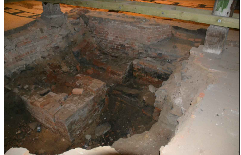
Widok wykopu i pozostałości pieca hypocaustum.