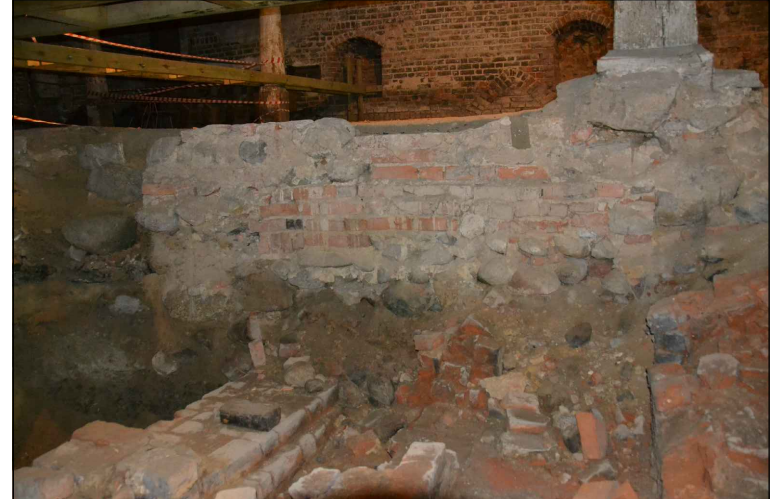
Widok wykopu i posadowienia słupa środkowego.