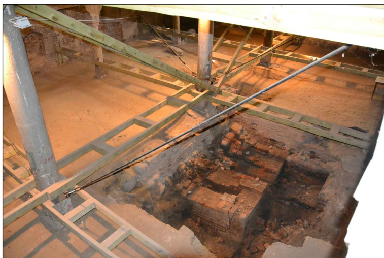
Widok z góry wykopu poarcheologicznego.