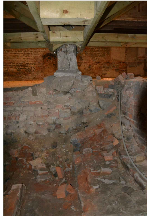
Miejsce podmurowania 5. słupa środkowego.