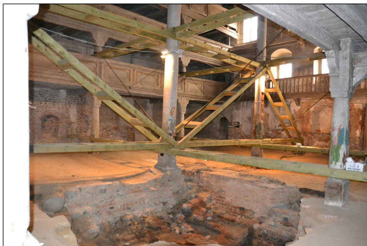
Widok słupa środkowego i wzmocnień zabezpieczających.