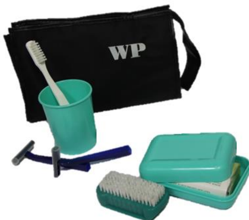
Zestaw przyborów do utrzymania higieny osobistej - Wzór 815/MON