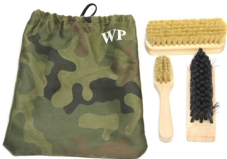
Zestaw przyborów do konserwacji obuwia - Wzór 816/MON