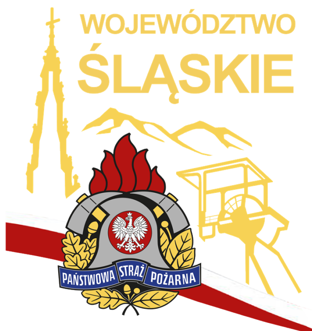
Emblemat PSP województwa śląskiego