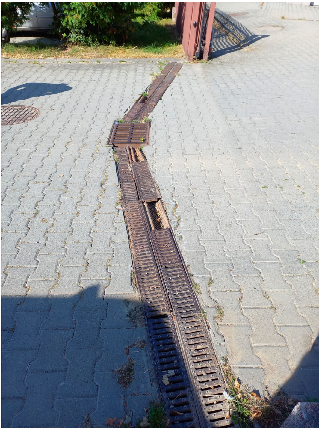
JT Kraków Podgórze, ul. Niwy 12