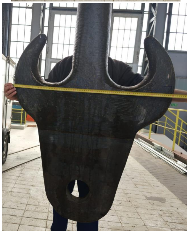
HAK 40t suwnica nr 1 i nr 2