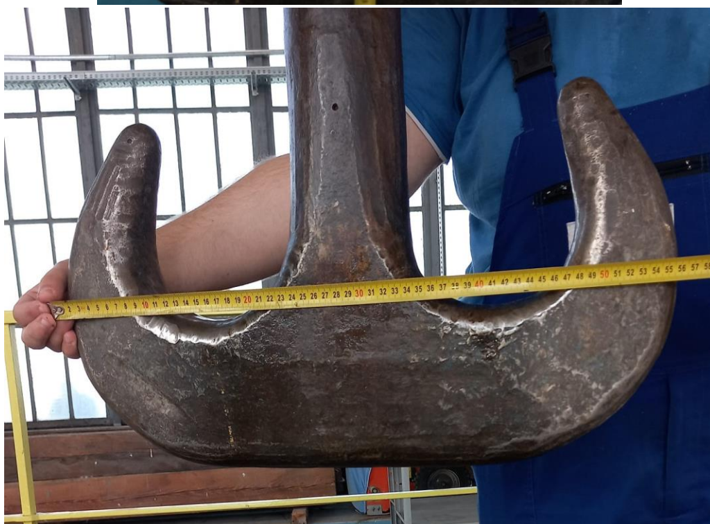
HAK 20t Suwnica nr 1 i nr 2