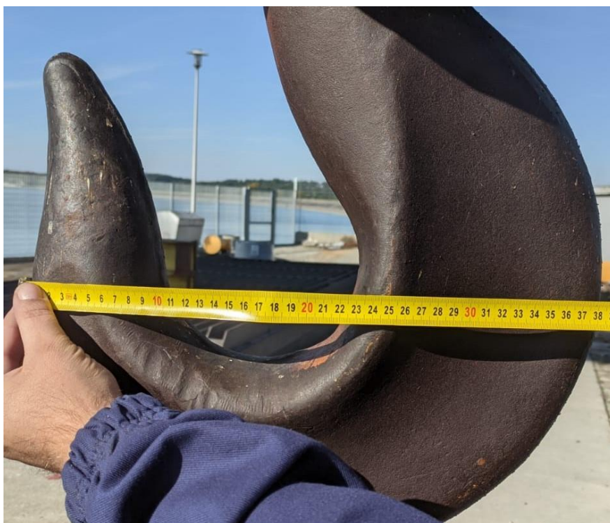
HAK 20T Ew Głębinów