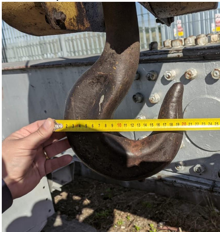
Hak 5T Suwnica EW Głębinów