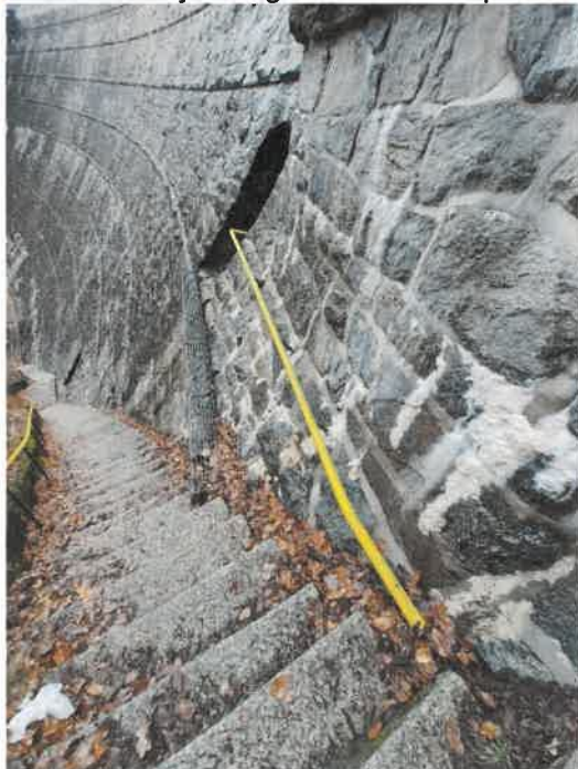
Zdj. 1 Obecny wygląd pomostu wymagającego zabezpieczenia