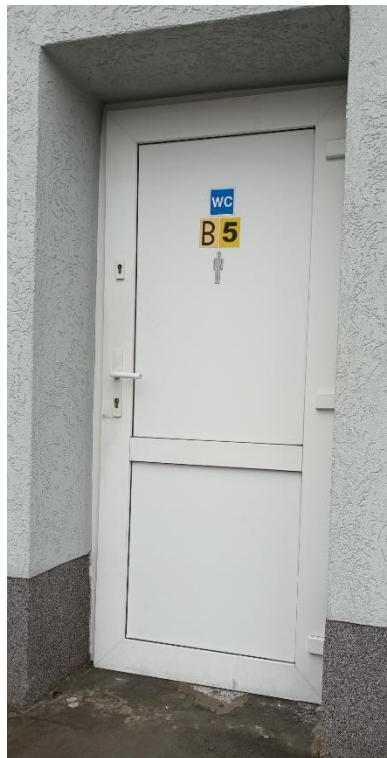
Zdjęcie istniejących drzwi