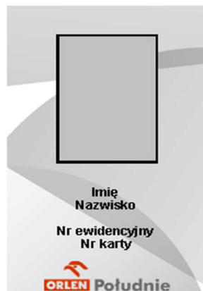
Karta dla pracownika ORLEN Południe S.A.