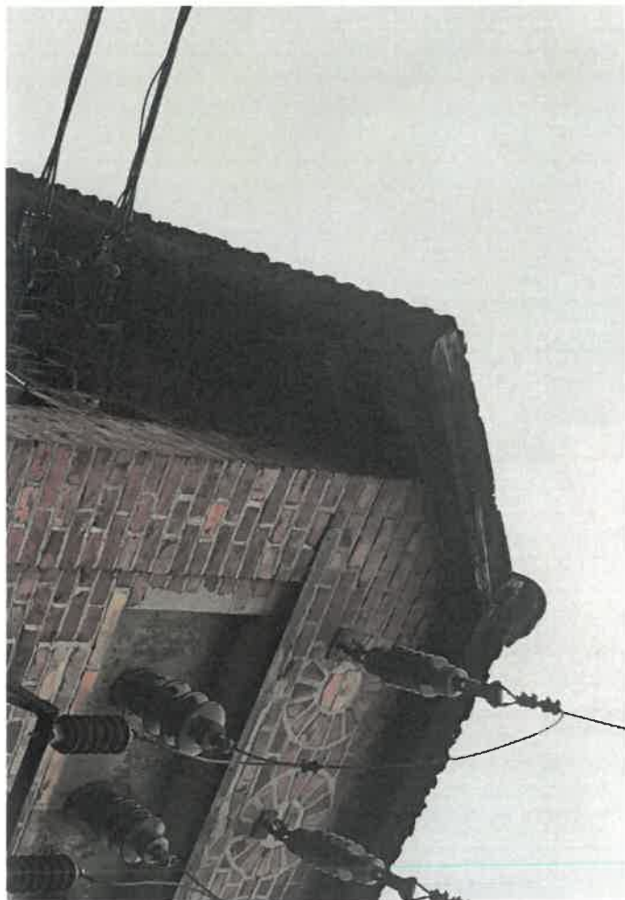
T-506 GŁOWCZYCE SEVPSKA