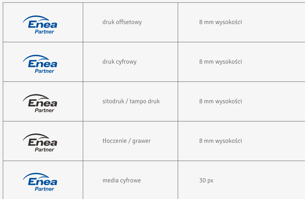
Tabela przedstawia minimalne wysokości znaku dla różnych technik drukarskich oraz mediów cyfrowych.