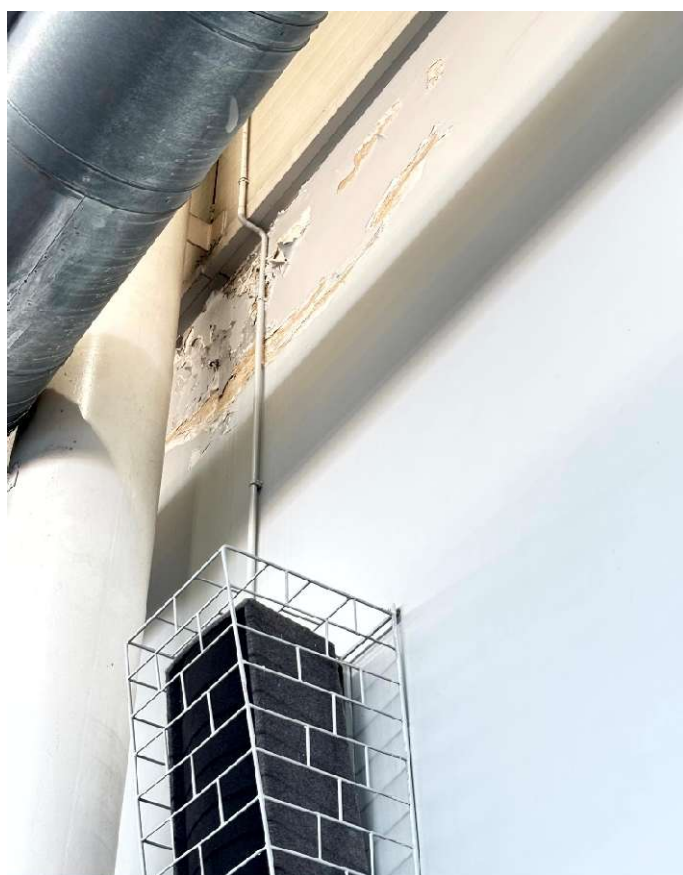
Fot. 30 Sala sportowa