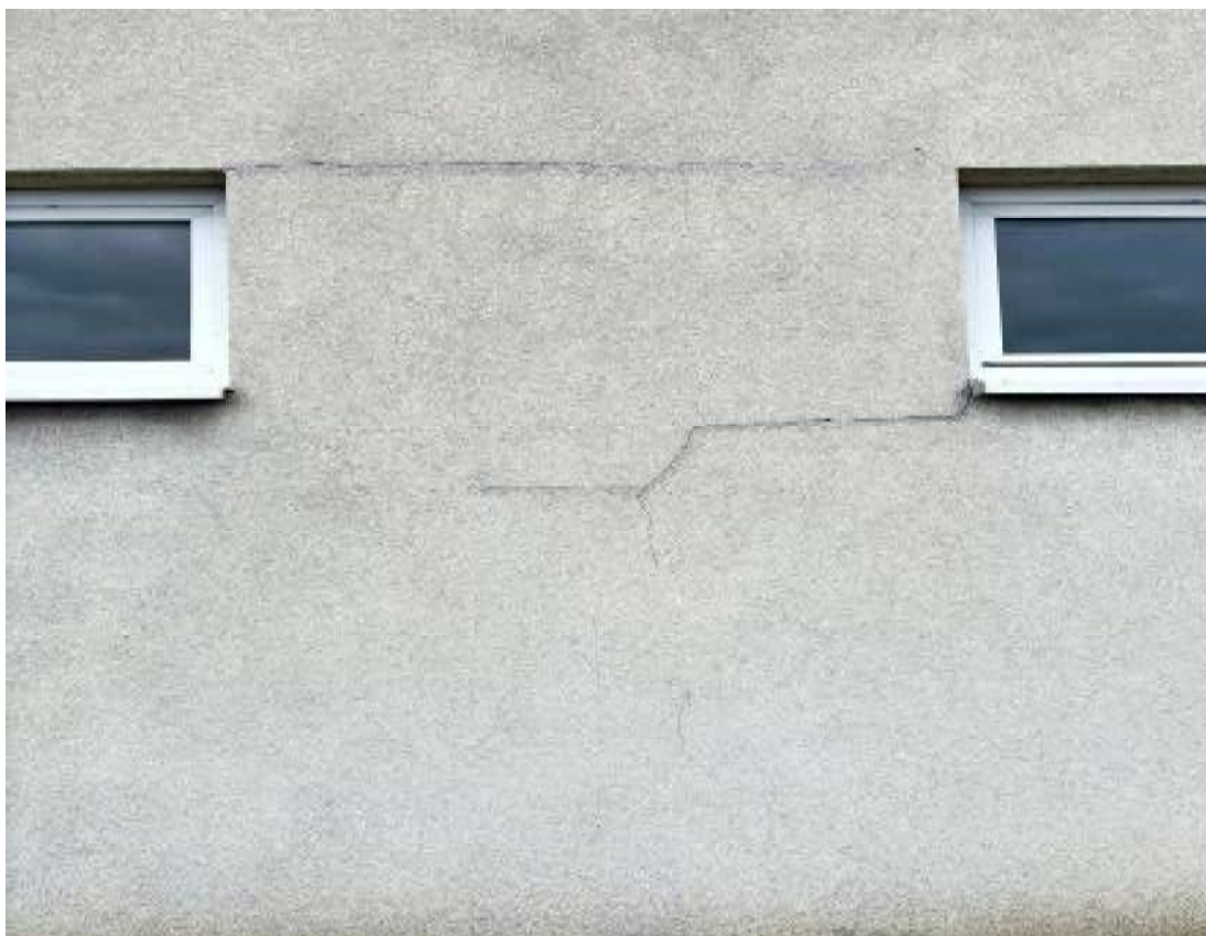
Fot. 7 Zaplecze sali sportowej – elewacja południowa (segment B)