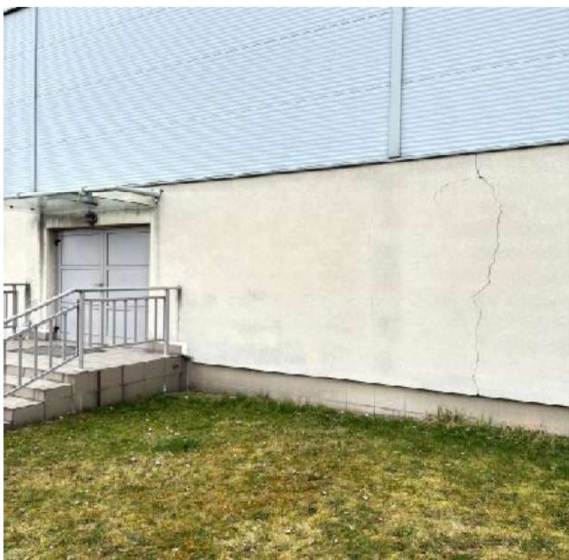
Fot. 22 Sala sportowa