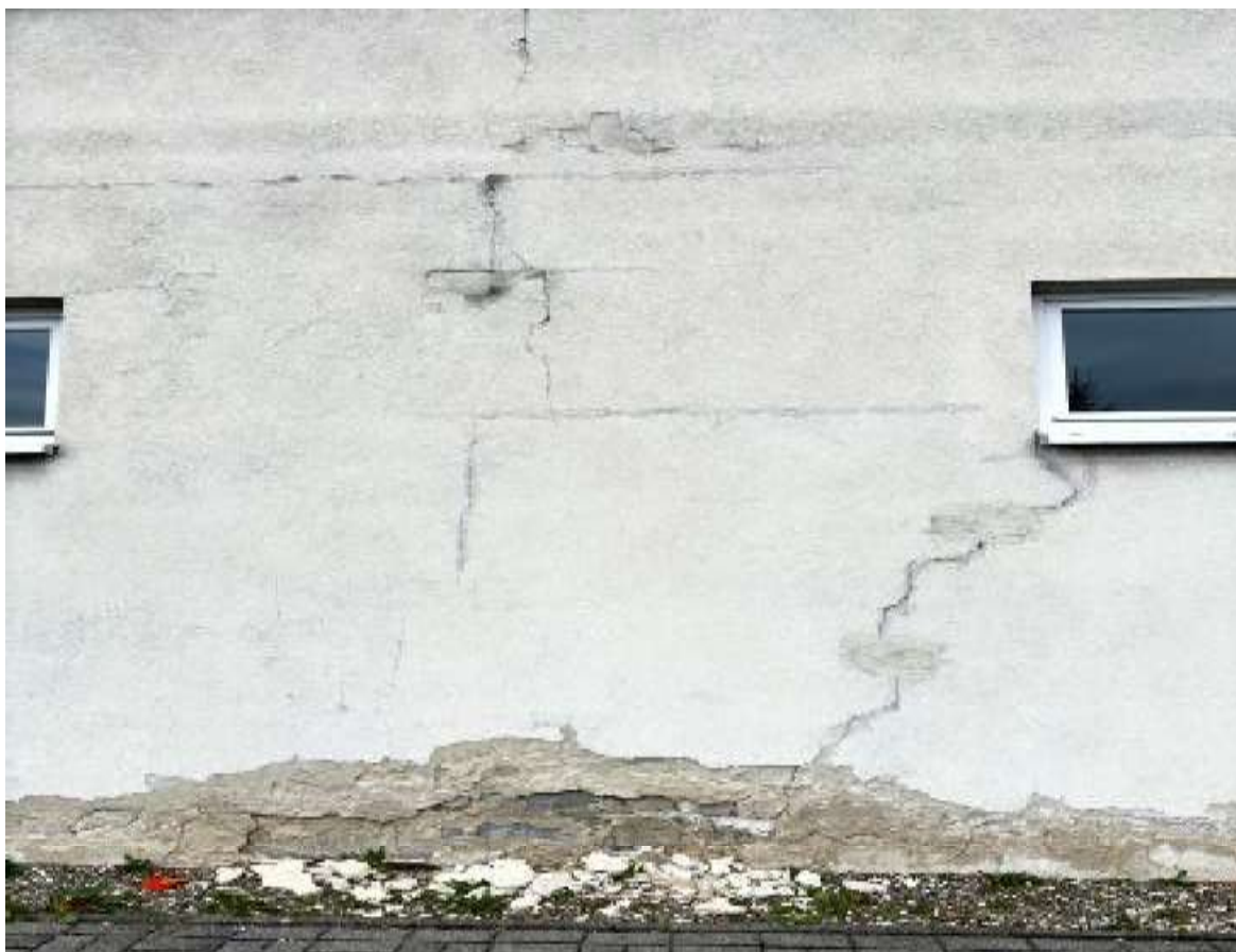
Fot. 17 Sanitariaty/szatnia – elewacja południowa (segment A)