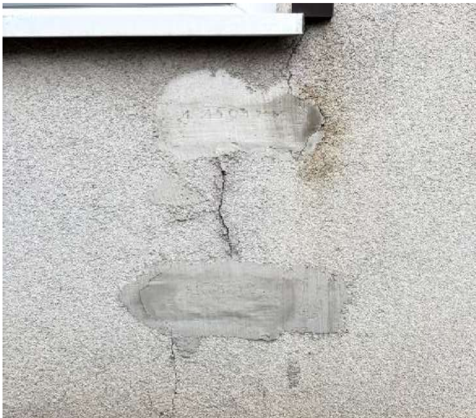
Fot. 14 Zaplecze sali sportowej – monitoring rys