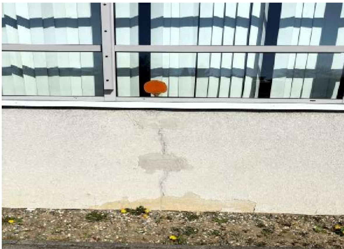
Fot. 19 Pomieszczenie siłowni – elewacja południowa (segment A)