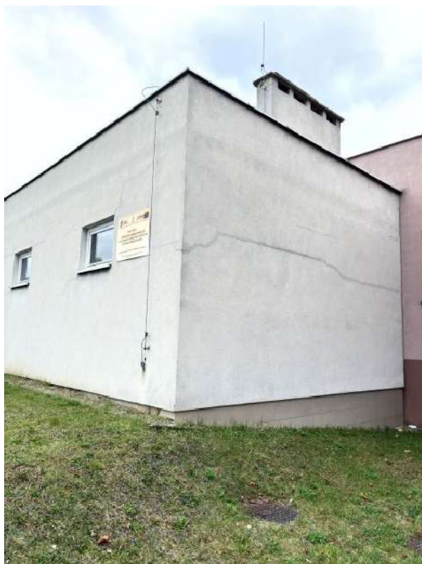
Fot. 5 Zaplecze sali sportowej – elew. wschodnia