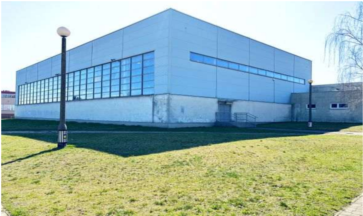
Fot. 2 Sala sportowa – elewacja północno-zachodnia