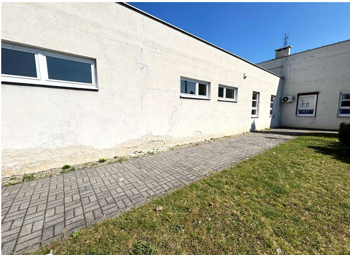
Fot. 16 Zaplecze sali sportowej – elewacja południowa (segment A)