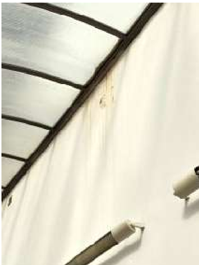
Fot. 29 Korytarz przy sali sportowej