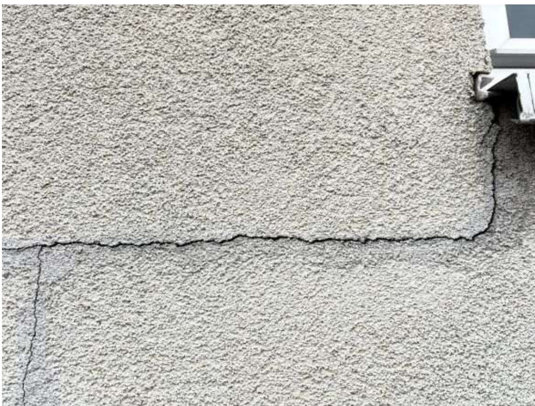
Fot. 8 Zaplecze sali sportowej