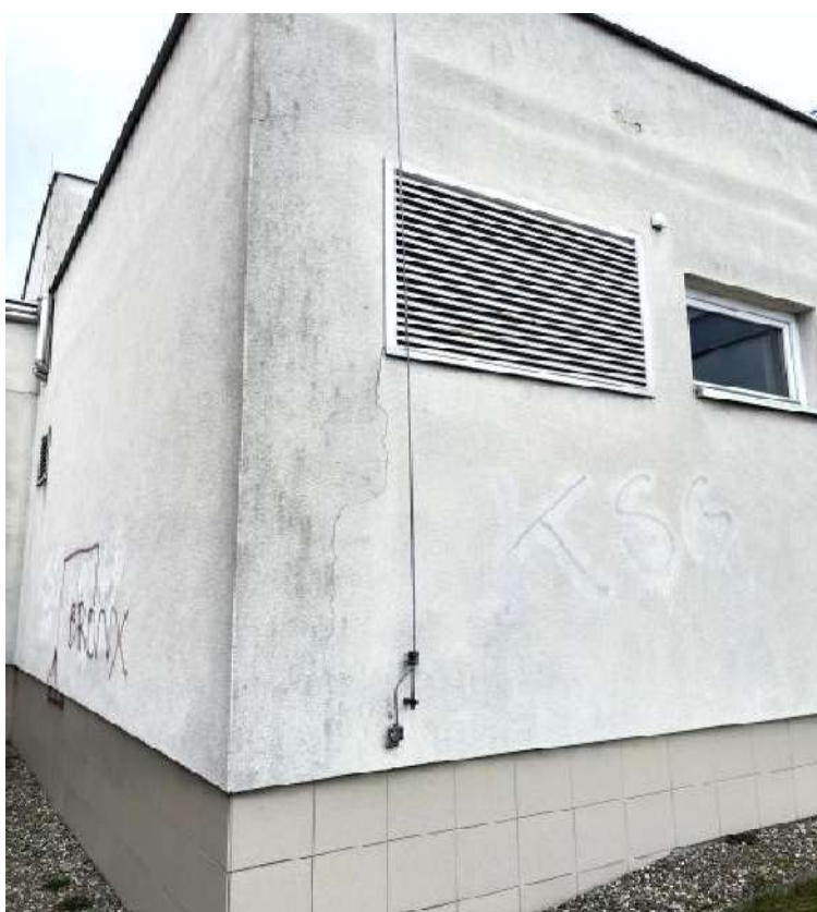
Fot. 26 Pomieszczenie techniczne