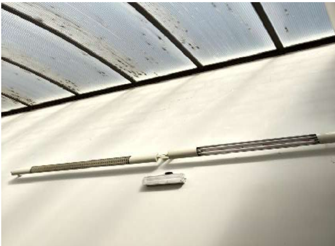
Fot. 28 Korytarz przy sali sportowej