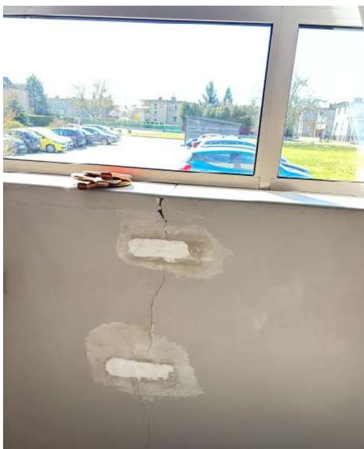
Fot. 34 Pomieszczenie siłowni