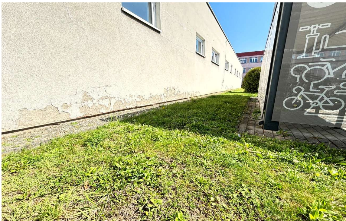
Fot. 11 Zaplecze sali sportowej – uszkodzony tynk w strefie cokołowej (segment B)