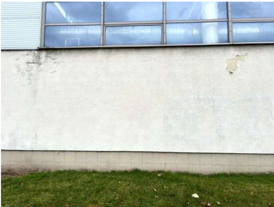
Fot. 24 Sala sportowa