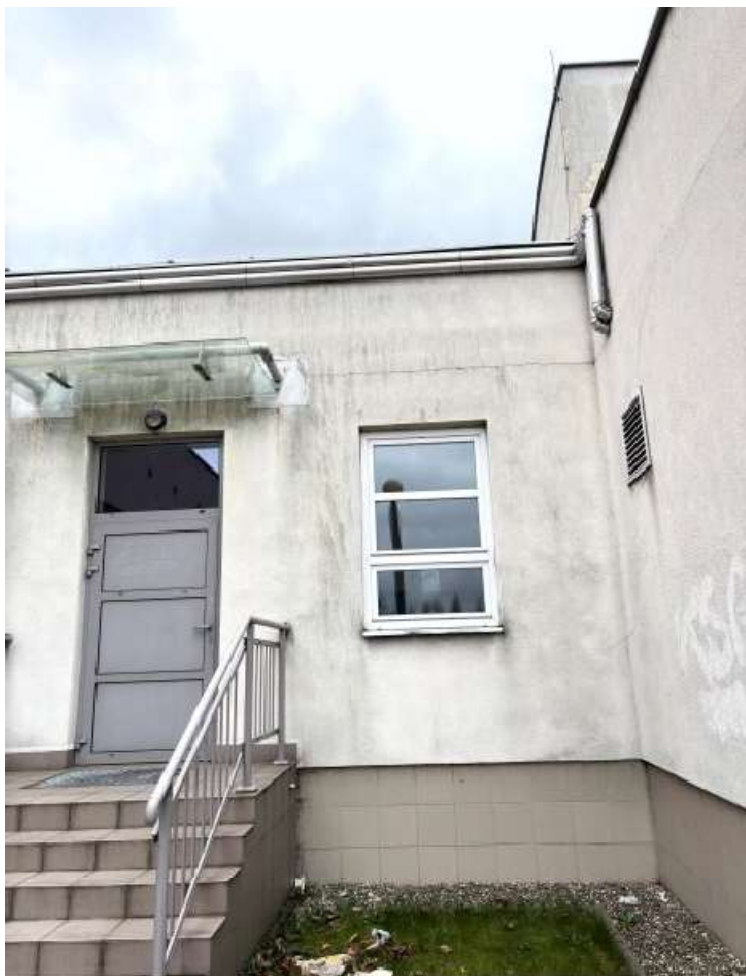
Fot. 27 Łącznik