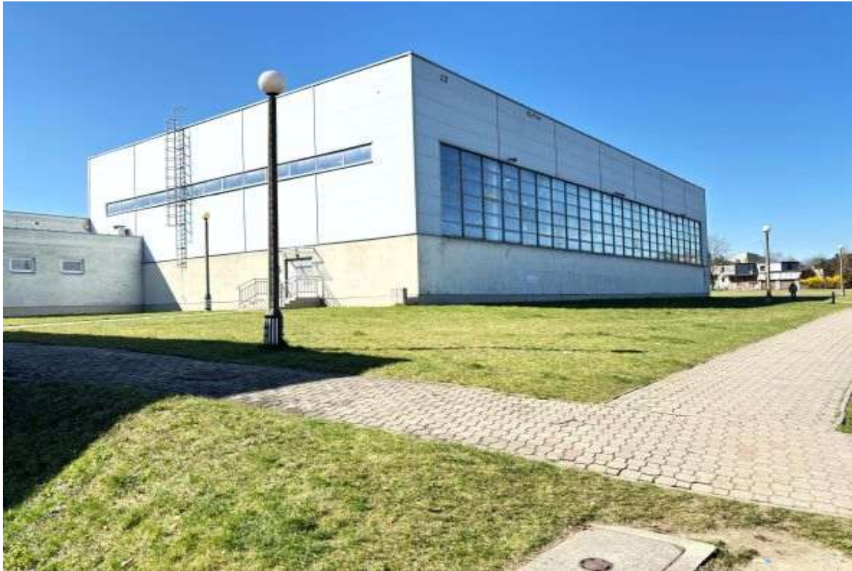
Fot. 1 Sala sportowa – elewacja północno-wschodnia

Dotyczy: Opracowanie dokumentacji projektowo-kosztorysowej modernizacji hali sportowej przy ZSEU w Rybniku