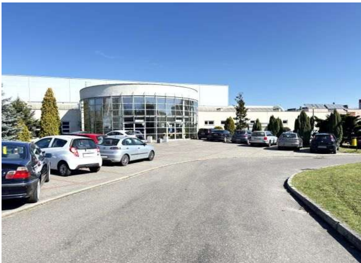
Fot. 3 Zaplecze sali sportowej – elewacja południowa