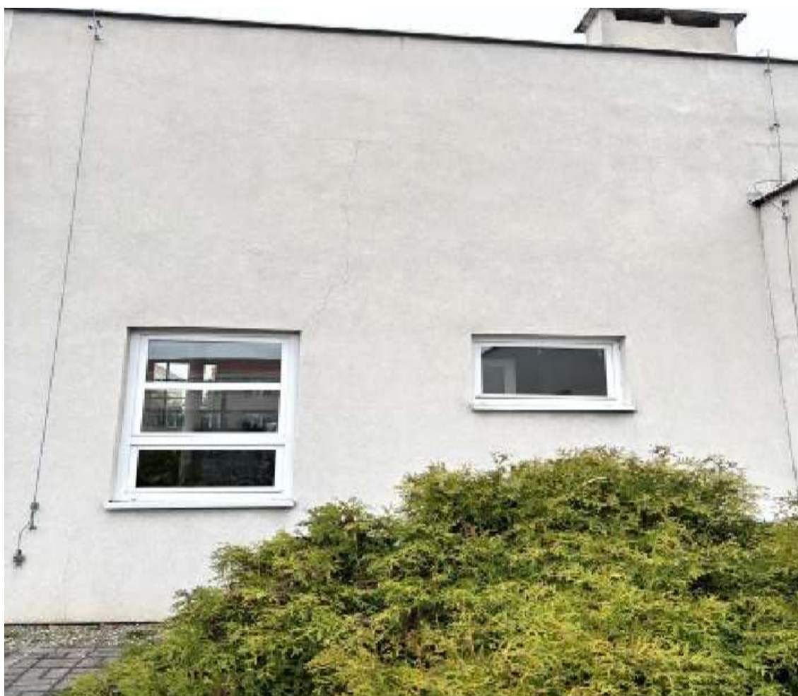
Fot. 12 Zaplecze sali sportowej – segment B