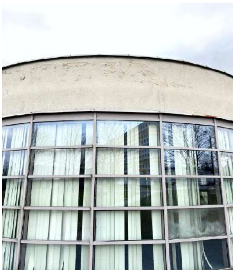
Fot. 21 Pomieszczenie fitness