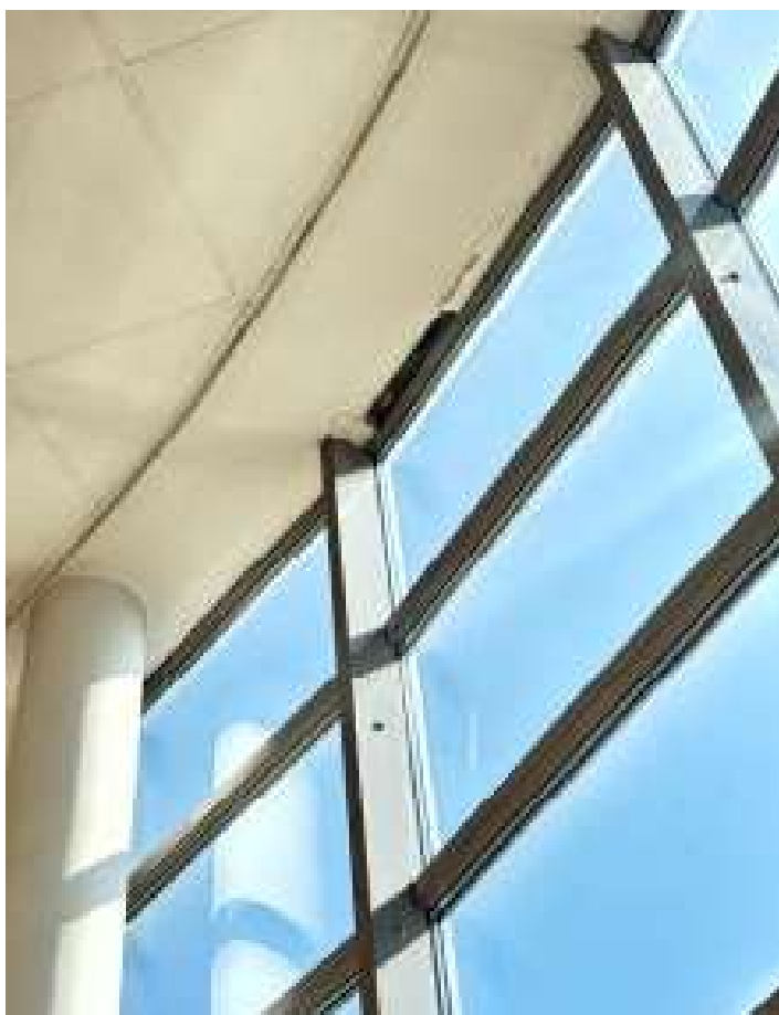
Fot. 33 Pomieszczenie fitness