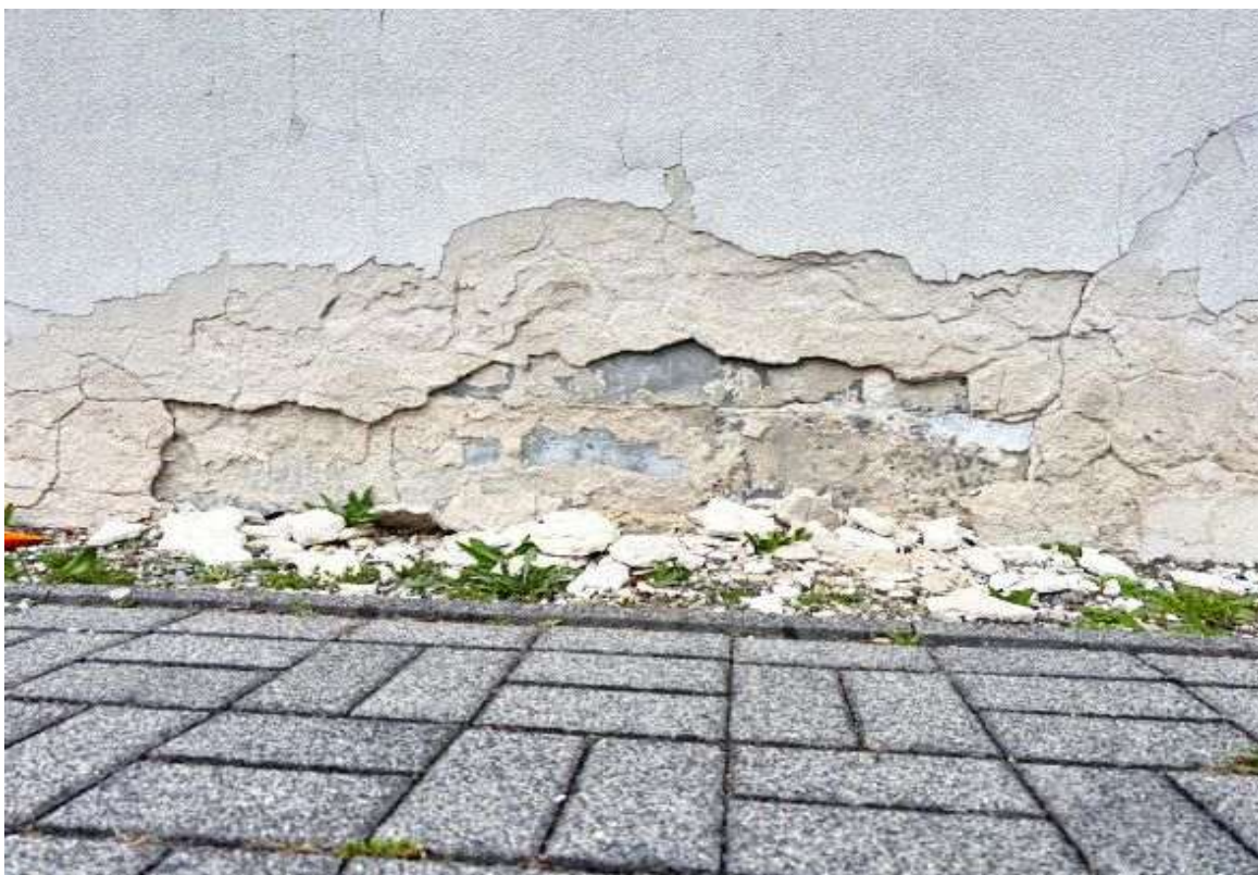
Fot. 18 Zaplecze sali sportowej