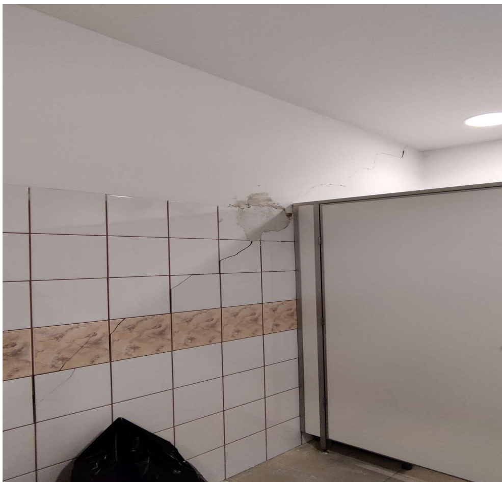
Fot. 35 Sanitariaty