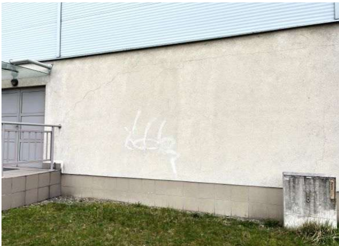
Fot. 25 Sala sportowa