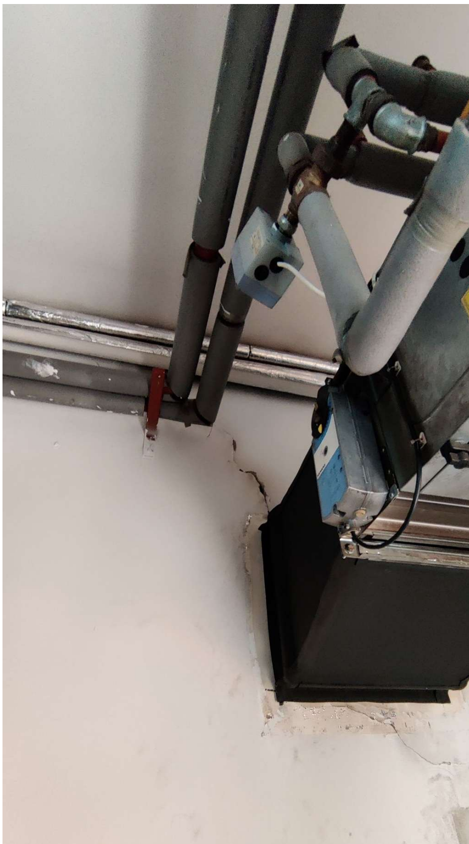
Fot. 37 Pomieszczenie techniczne