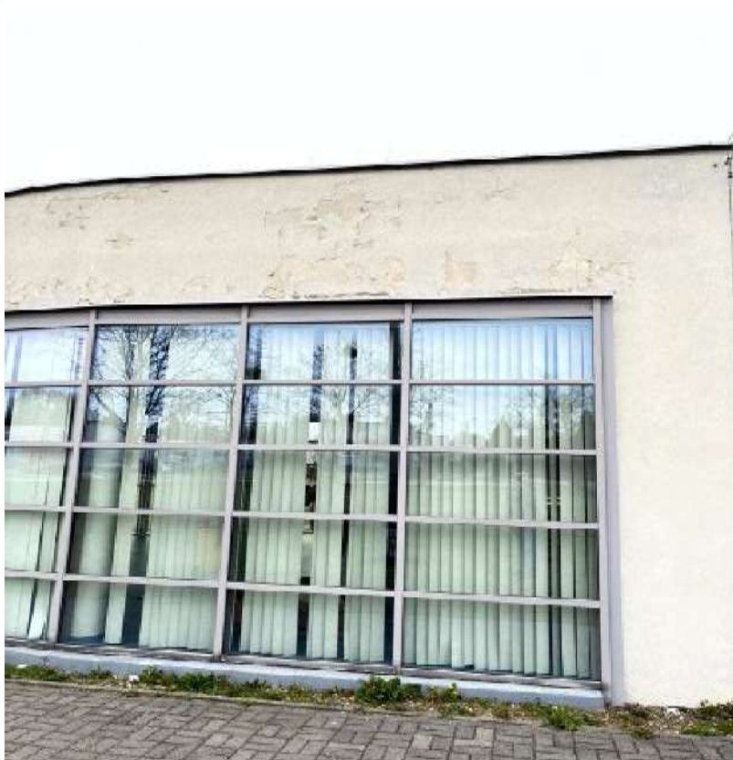
Fot. 20 Pomieszczenie fitness