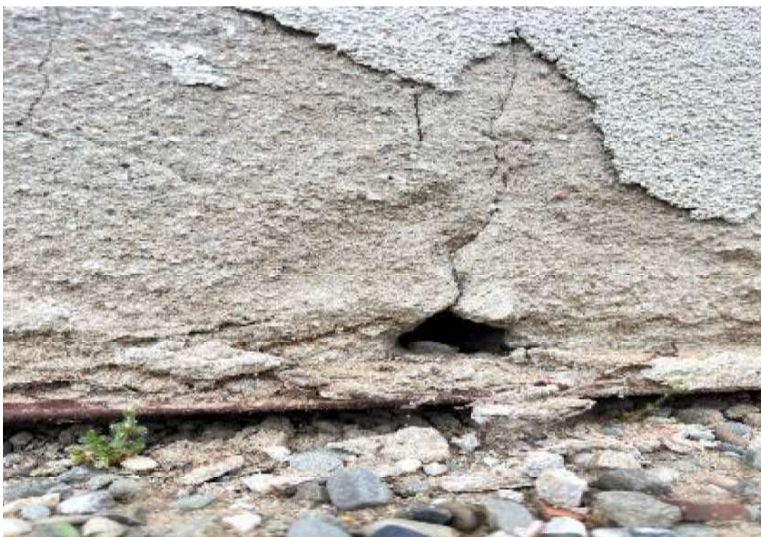
Fot. 10 Zaplecze sali sportowej – uszkodzenia w strefie cokołowej