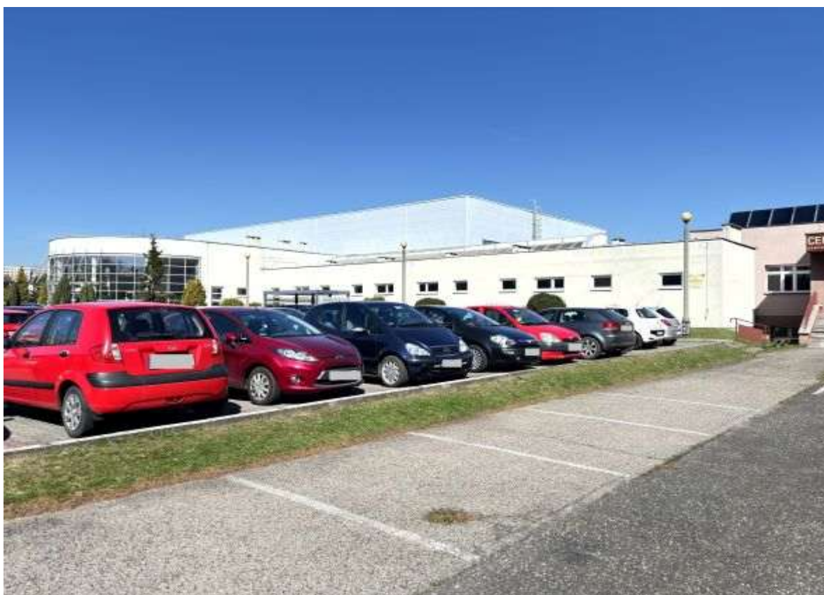
Fot. 4 Zaplecze sali sportowej – elewacja południowo-wschodnia