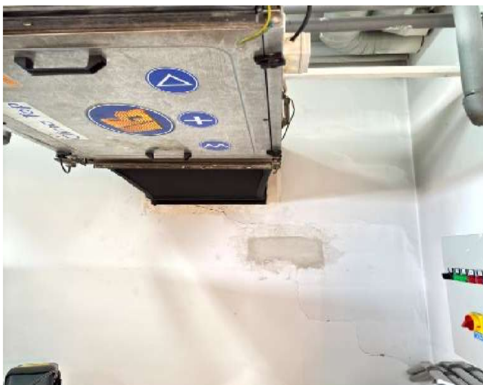
Fot. 36 Pomieszczenie techniczne