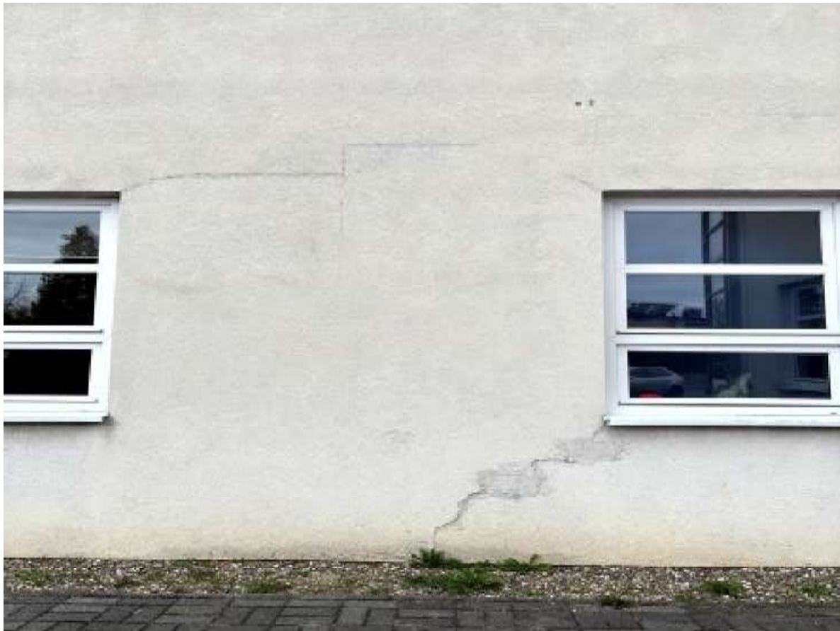
Fot. 13 Zaplecze sali sportowej – elewacja południowa (segment A)