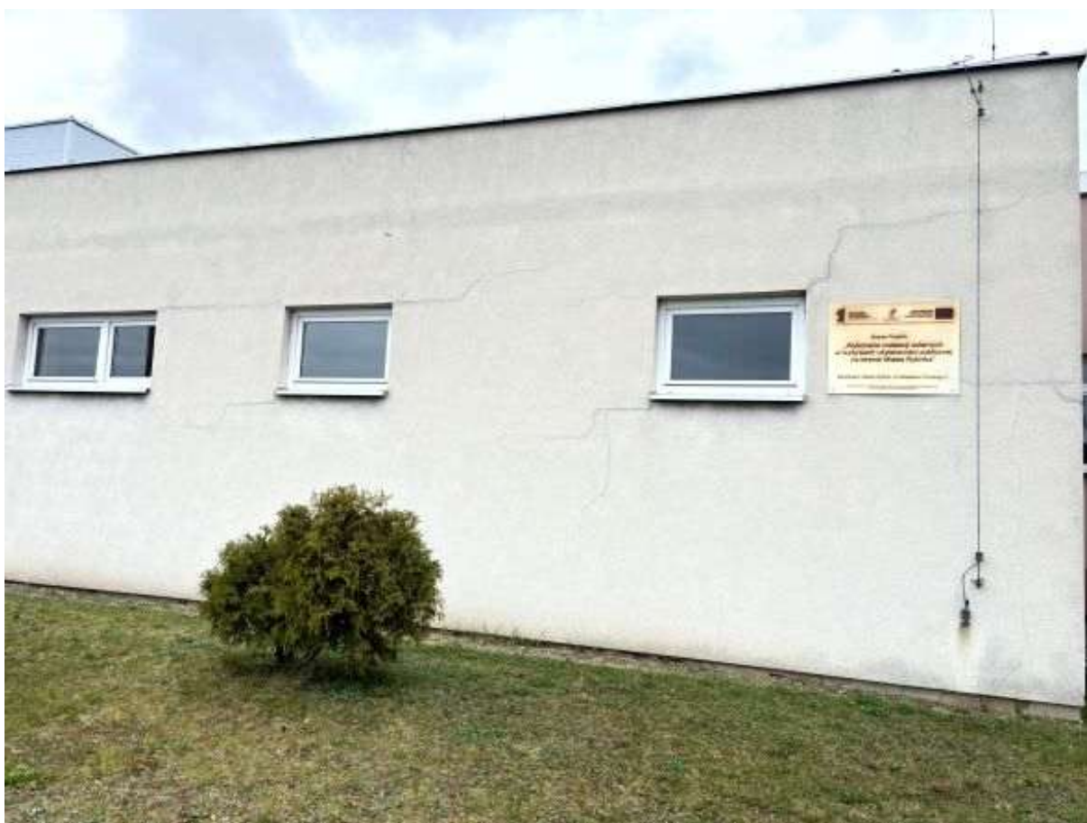
Fot. 6 Zaplecze sali sportowej – elewacja południowa (segment B)