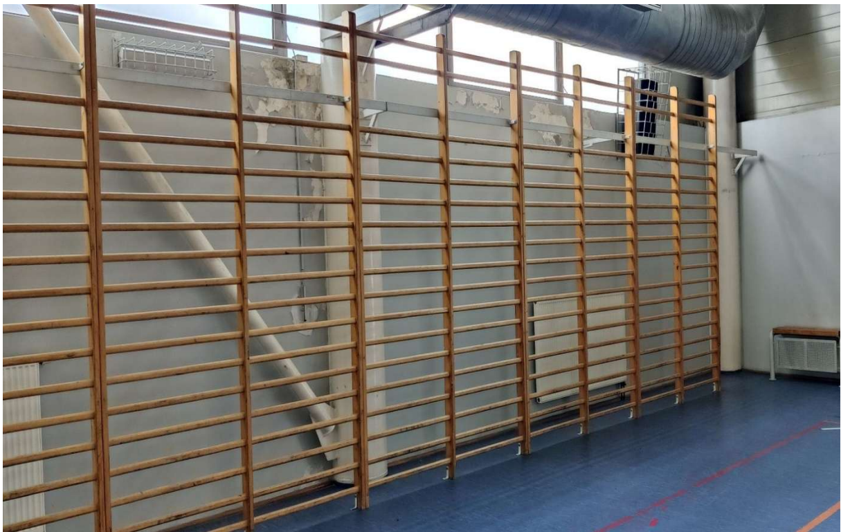
Fot. 32 Sala sportowa