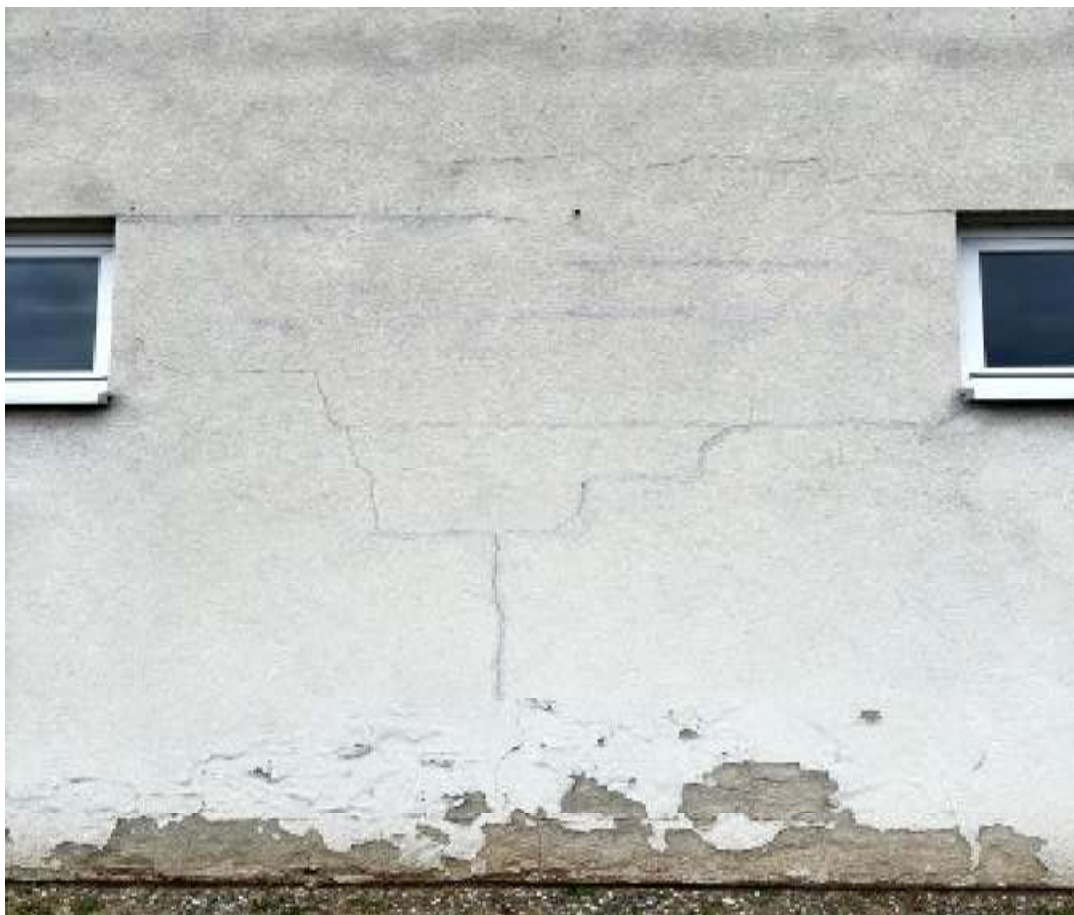
Fot. 9 Zaplecze sali sportowej – elewacja południowa (segment B)