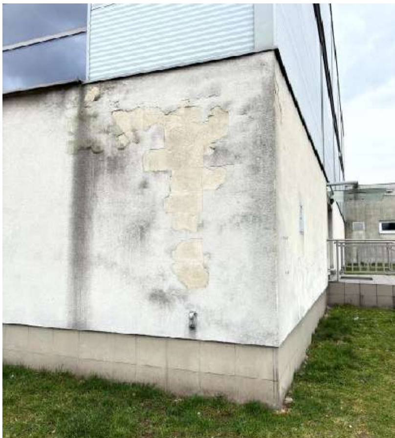
Fot. 23 Sala sportowa