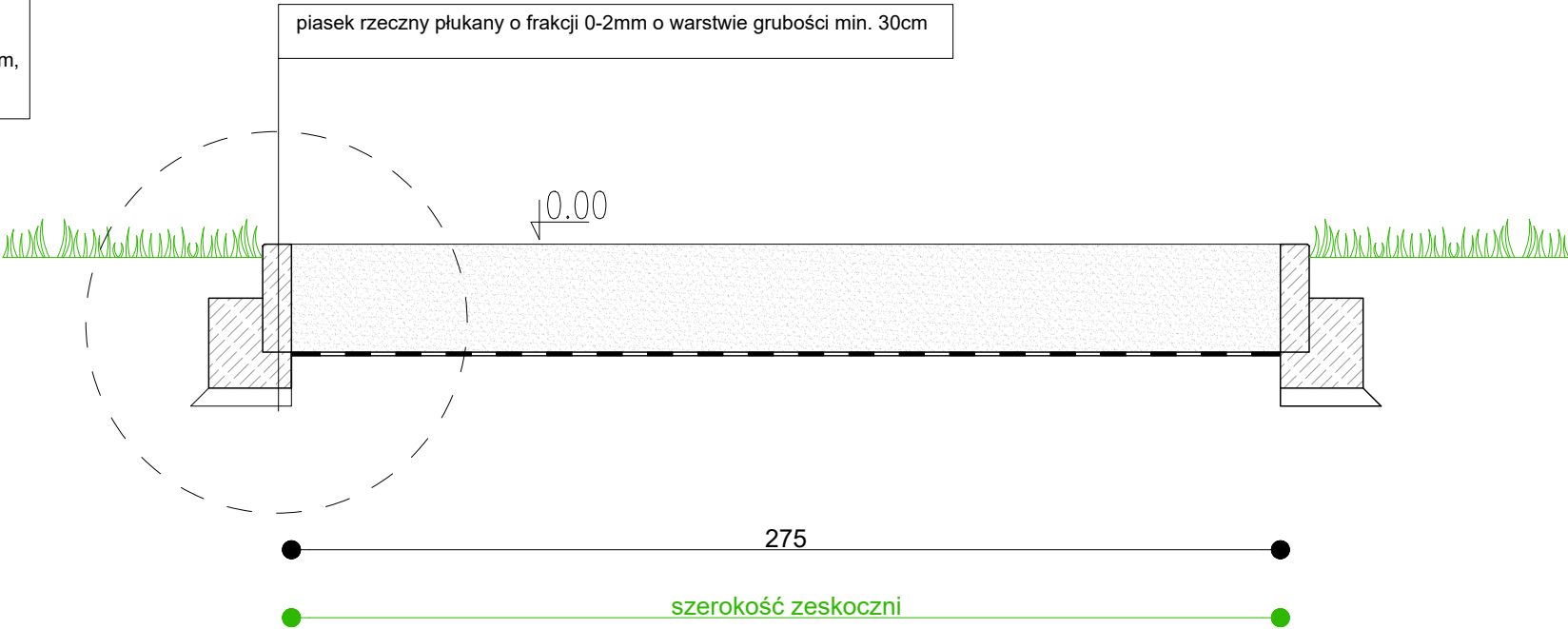
PRZEKRÓJ PRZEZ ZESKOCZNIE 1:20