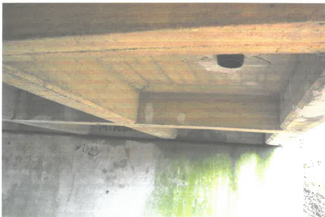
Fot. 4. Widok od spodu na konstrukcję obiektu