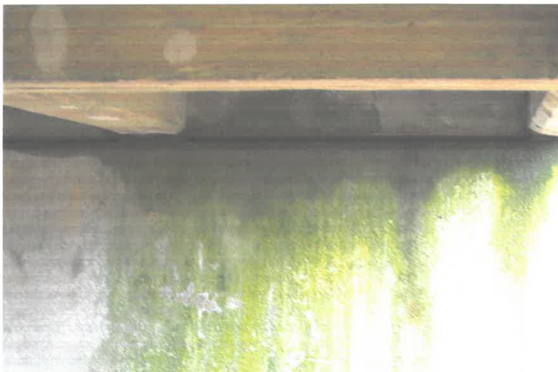
Fot. 4. Widoczny zaciek na przyczółku oraz ubytki betonu w poprzecznicy.