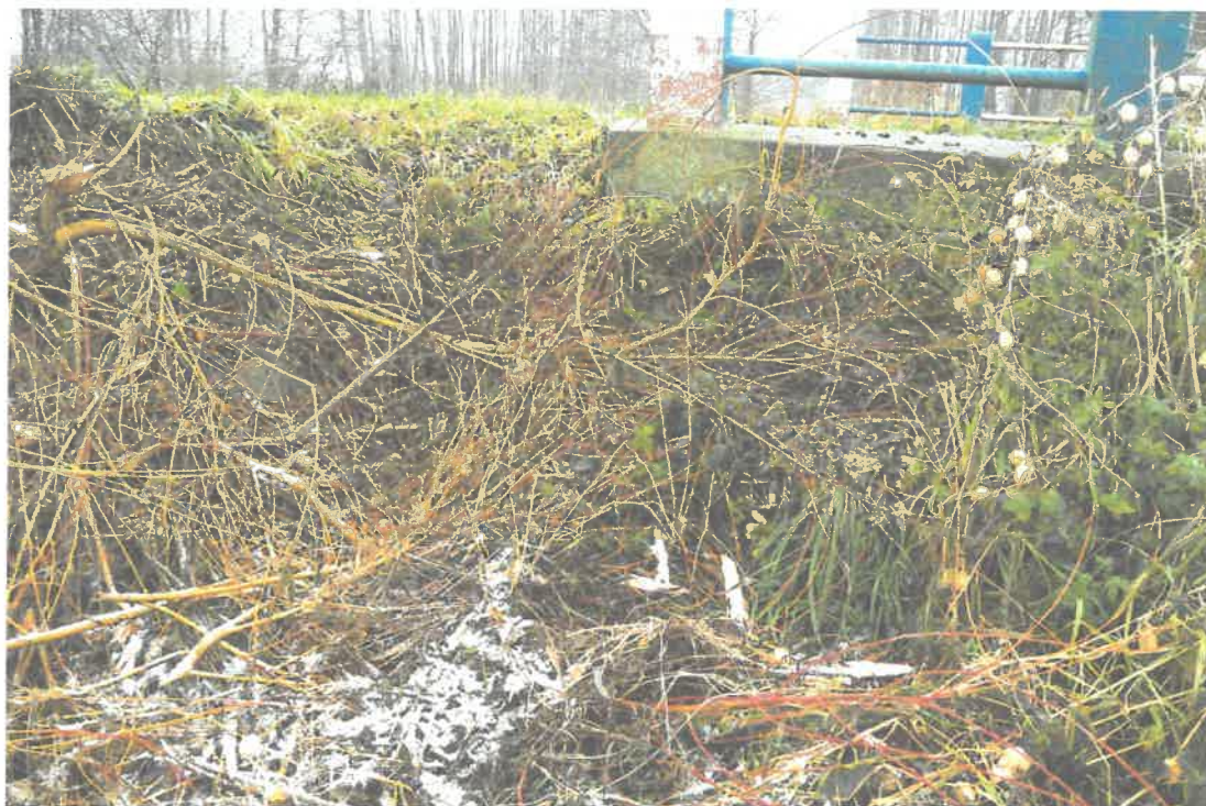
Fot. 1. Zanieczyszczone i zniszczone umocnienie stożków.