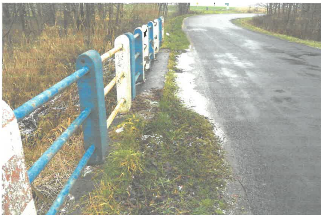
Fot. 2 Widoczne zanieczyszczenia i wegetacja roślin na płycie pomostu.