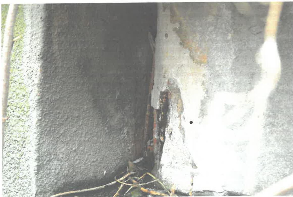
Fot. 6. Widoczny degradacja belki w obrębie podpory.