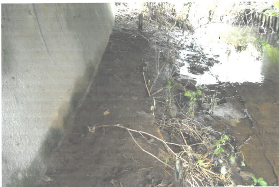
Fot. 5. Zniszczone umocnienie skarp pod obiektem..