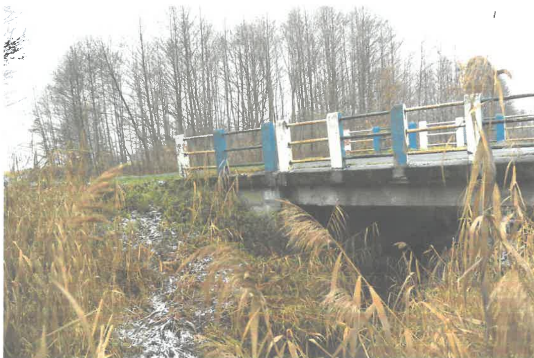
Fot. 2 . Widok od strony NW.