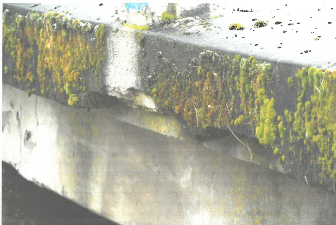
Fot. 3. Wegetacja roślin i ubytki betonu w belce podporęczowej..