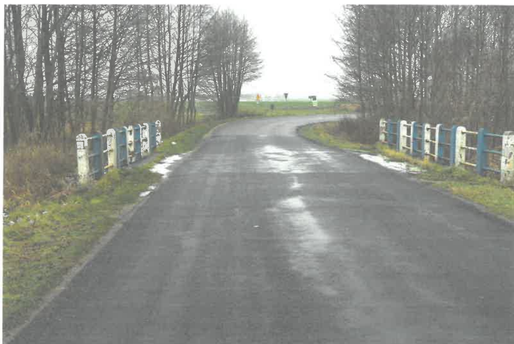
Fot. 1. Widok od strony dojazdu