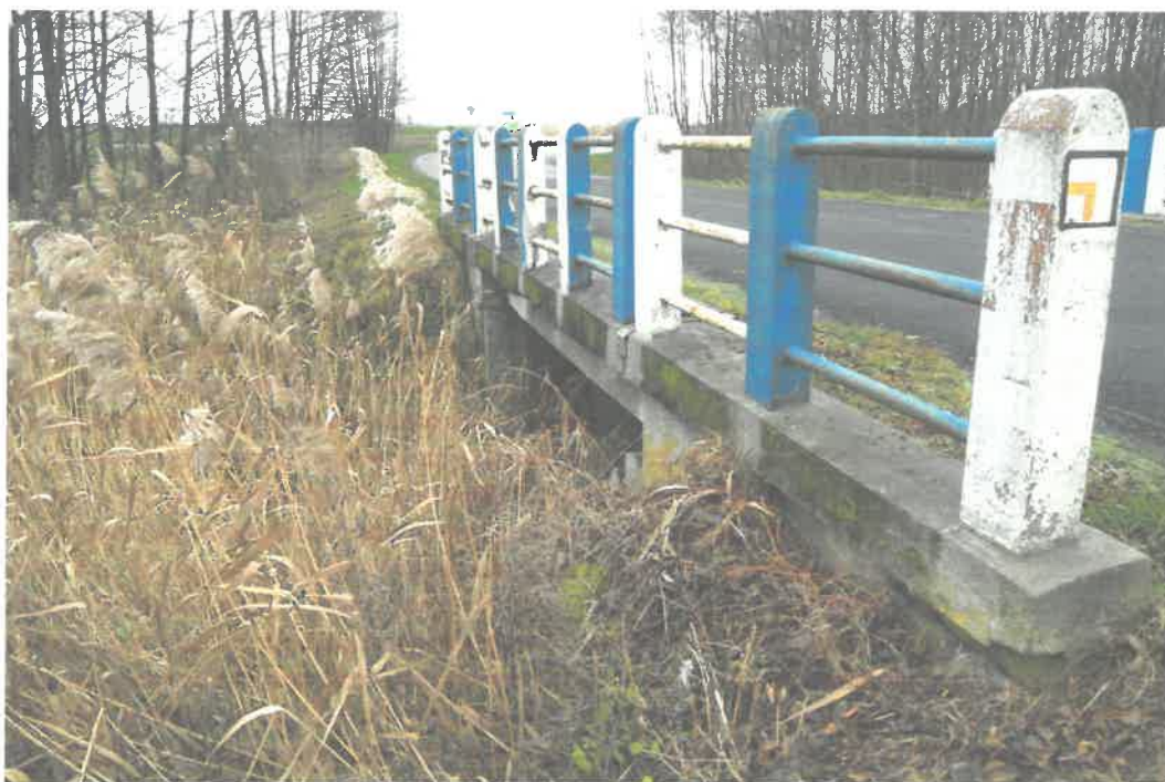
Fot. 3. Widok od strony WW.