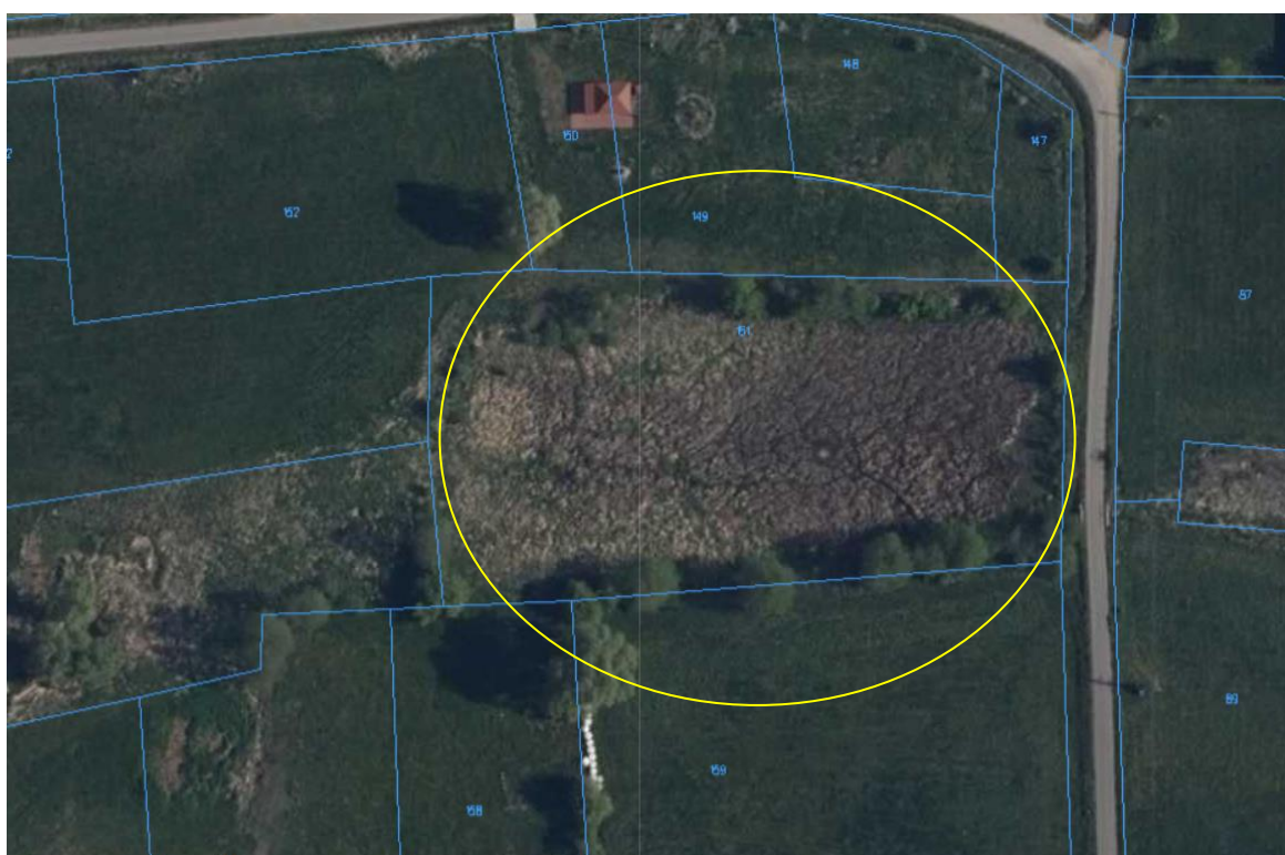
Rys. nr 2. Lokalizacja przedsięwzięcia – dane katastralne

Teren inwestycji ma kształt prostokąta o wymiarach około 65 na 125 metrów. Od strony wschodniej teren jest ograniczony drogą gminną. Z pozostałych stron jest otoczony działkami użytkowymi rolniczo.