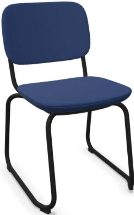
KG (206) - krzesło gabinetowe