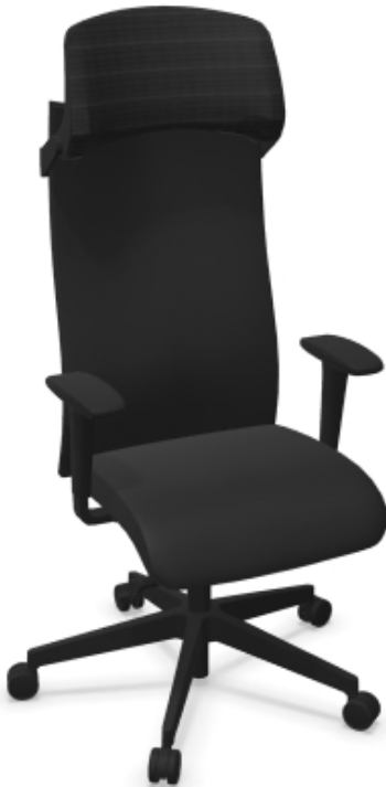
FG (407) - fotel gabinetowy