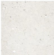
płytki - kamień