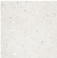
kafelki - kamień