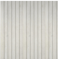
kafelki - imitacja drewna