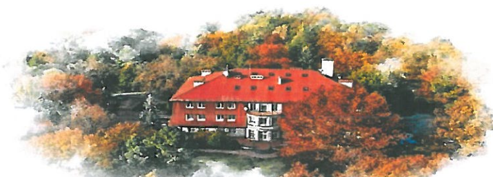
Dom Pomocy Społecznej im. Jana Pawła II w Głownie

95-015 GŁOWNO ul. Karasicka 51 tel. (042) 716-43-77, 716-30-01 tel./fax (042) 719-41-65 www.dps.glowno.pl mail: dps@dps.glowno.pl