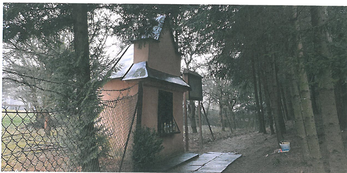
Fot 4. Kapliczka Matki Boskiej Pocieszenia w Podegrodziu. Widok ogólny z boku.

Z informacji umieszczonej na stronie gminy wynika, że kapliczka wzniesiona w XVIII wieku, z fundacji rodziny Krajewskich, na miejscu starszej, z XVII wieku. Zbudowana z cegły i kamienia, otynkowana. Od frontu szczyt prostokątny, wydzielony okapem, z głęboką, zaskloną wnęką, w której znajduje się figurka Św. Kingi, po lewej raz Chrystusa w cierniowej koronie, a po prawej Matki Boskiej Częstochowskiej. Kapliczka była kilka razy odnawiana