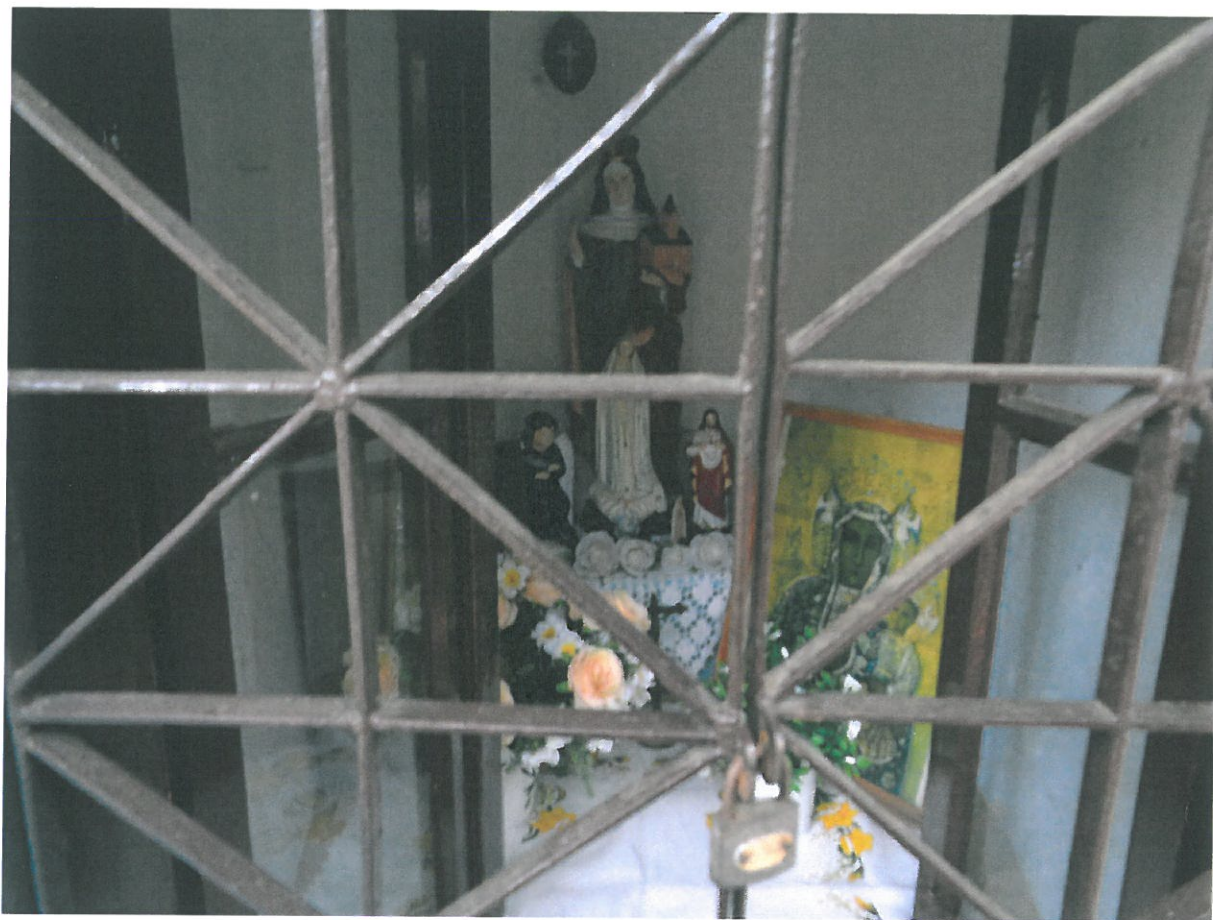
Fot 7. Kapliczka Matki Boskiej Pocieszenia w Podegrodziu. Widok wnętrza przez kraty.

We wnętrzu na uwagę zasługuje drewniana polichromowana figura z przedstawieniem Św. Kingi. Resztę wyposażenia stanowią gipsowe figurki, oleodruki oraz sztuczne kwiatki. Z oleodruków restauracji należy poddać obraz Matki Bożej Częstochowskiej i Chrystusa w cierniowej koronie.