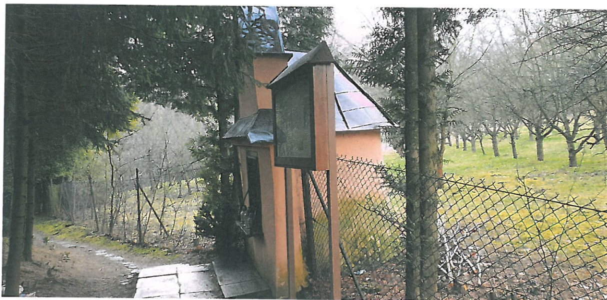
Fot 3. Kapliczka Matki Boskiej Pocieszenia w Podegrodziu. Widok ogólny z boku.

PROGRAM KONSERWATORSKI DOTYCZĄCY PRAC RENOWACYJNYCH PRZY MUROWANEJ KAPLICZCE MATKI BOSKIEJ POCIESZENIA W MIEJSCOWOŚCI PODEGRODZIE, GMINA PODEGRODZIE, POWIAT NOWOSĄDECKI, WOJ. MAŁOPOLSKIE.