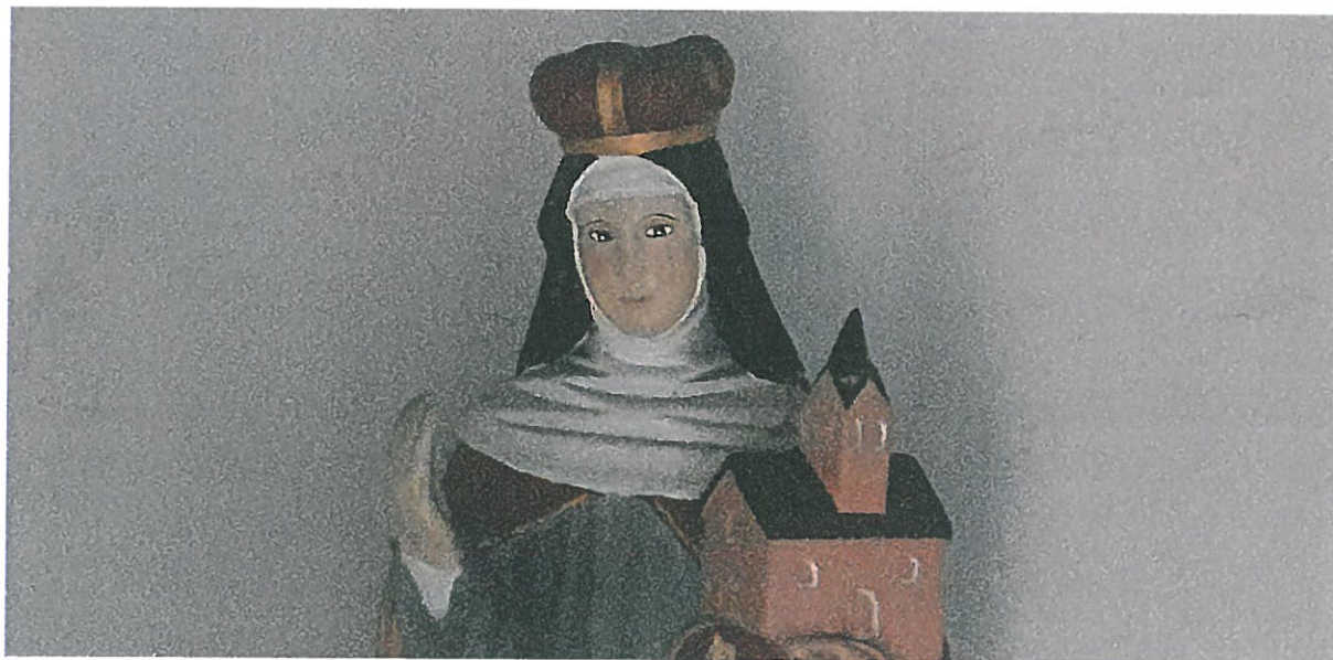
Fot 10. Kapliczka Matki Boskiej Pocieszenia w Podegrodziu. Figura św. Kingi- fragment.

1. Demontaż i przewiezienie do pracowni konserwatorskiej.