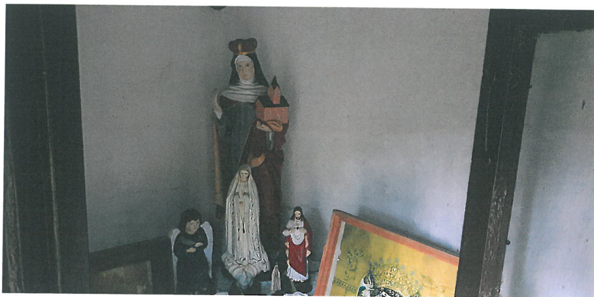
Fot 6. Kapliczka Matki Boskiej Pocieszenia w Podegrodziu. Widok wnętrza.

Obecnie ściany kapliczki pokryte są cienką warstwą tynku cementowego i pomalowane farbą emulsyjną.