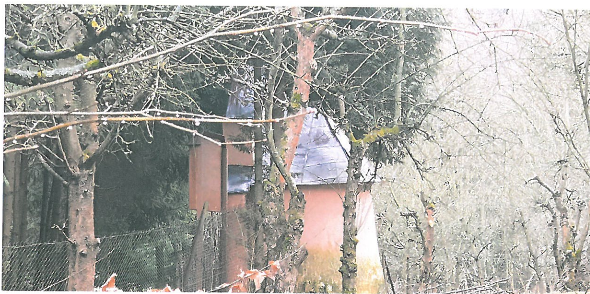
Fot 9. Kapliczka Matki Boskiej Pocieszenia w Podegrodziu. Widok ogólny.