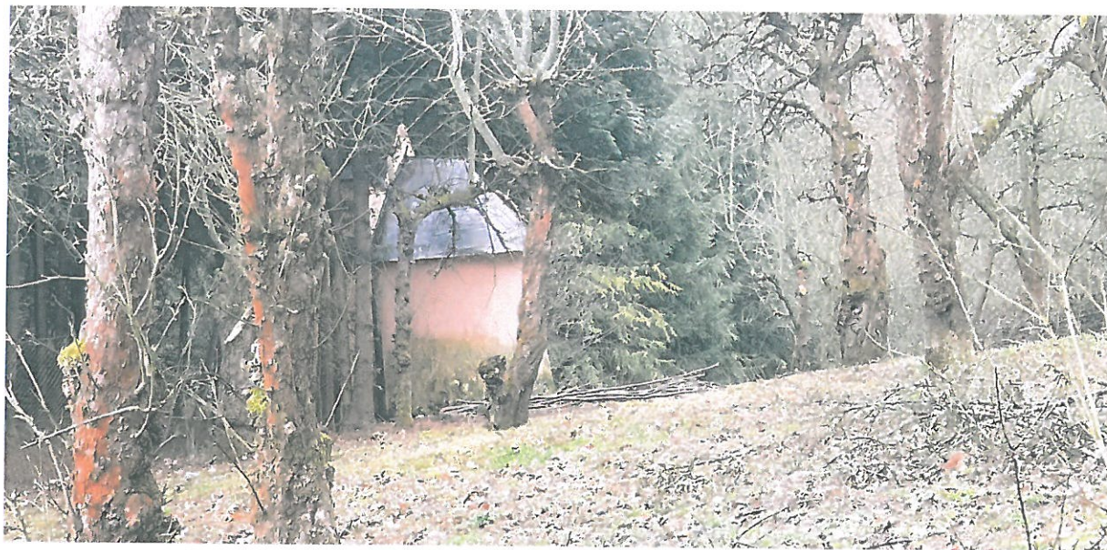
Fot 8. Kapliczka Matki Boskiej Pocieszenia w Podegrodziu. Widok ogólny.

Po wyschnięciu ściany kapliczki należy wybielić kilkakrotnie wapnem gaszonym dołowanym /najlepiej kilkunastoletnim/ . Ostatnie warstwy należy zmieszać z niewielką ilością ultramaryny . Zaleca się zrobić próby i zatwierdzić na komisji konserwatorskiej.