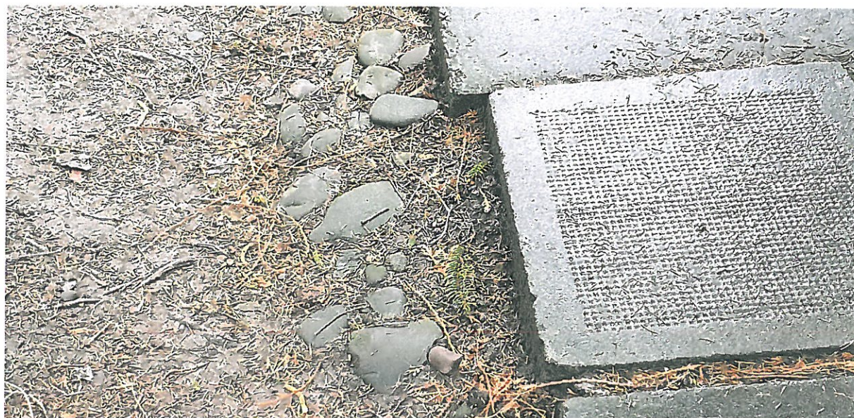
Fot 11. Kapliczka Matki Boskiej Pocieszenia w Podegrodziu. Betonowe płyty chodnikowe, które należy usunąć. W ich miejsce zaleca się położyć nieregularne płyty piaskowcowe na podsypce żwirowej.

PROGRAM KONSERWATORSKI DOTYCZĄCY PRAC RENOWACYJNYCH PRZY MUROWANEJ KAPLICZCE MATKI BOSKIEJ POCIESZENIA W MIEJSCOWOŚCI PODEGRODZIE, GMINA PODEGRODZIE, POWIAT NOWOSĄDECKI, WOJ. MAŁOPOLSKIE.