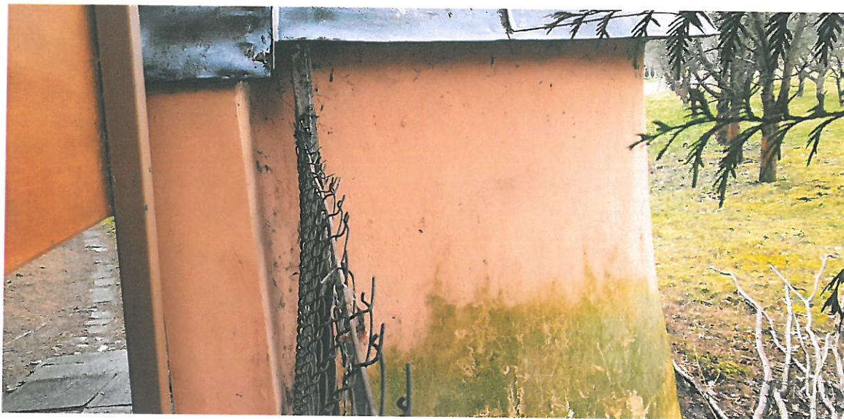
Fot 5. Kapliczka Matki Boskiej Pocieszenia w Podegrodziu. Widok z boku -zagrzybienie ścian.

PROGRAM KONSERWATORSKI DOTYCZĄCY PRAC RENOWACYJNYCH PRZY MUROWANEJ KAPLICZCE MATKI BOSKIEJ POCIESZENIA W MIEJSCOWOŚCI PODEGRODZIE, GMINA PODEGRODZIE, POWIAT NOWOSĄDECKI, WOJ. MAŁOPOLSKIE.