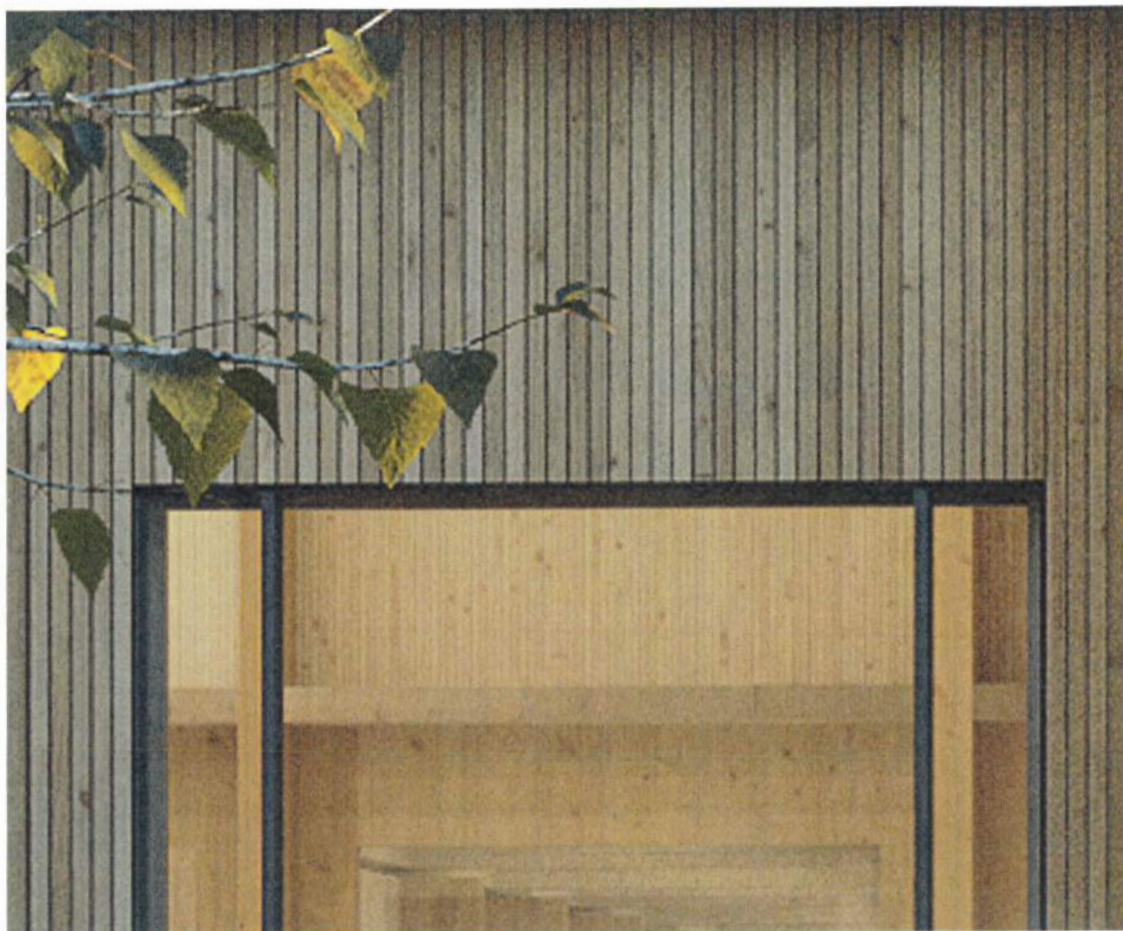
Zdj. Nr 2 Przykładowy widok elewacji drewnianej.