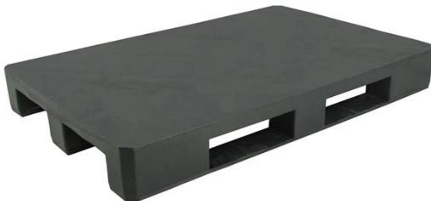
Rys. 2a. Paleta plastikowa z płożami