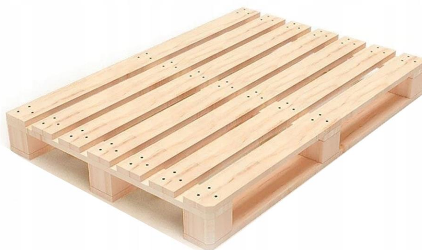
Rys. 2b. Paleta drewniana z płożami