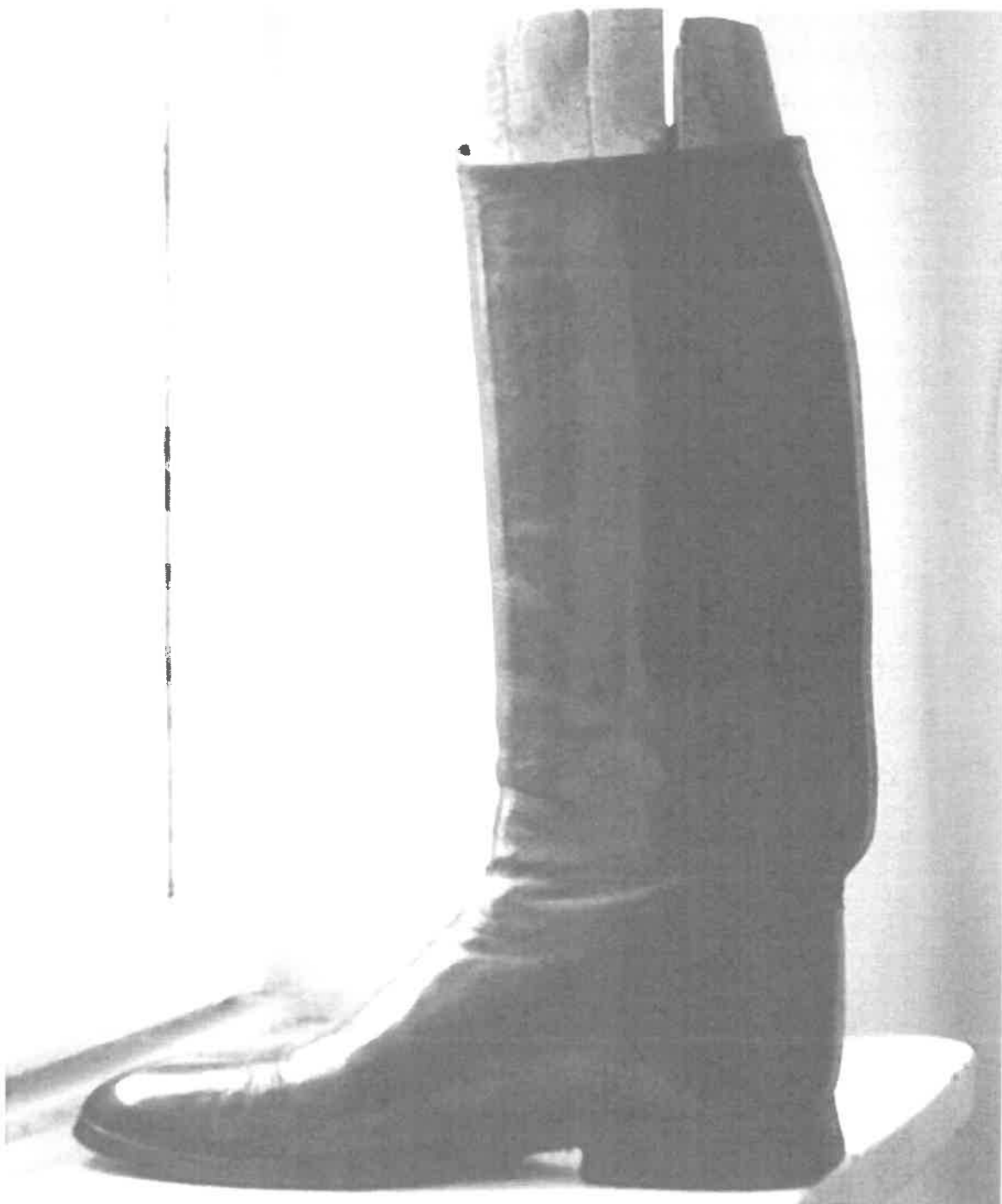
Buty oficerskie - Wzór 907A/MON