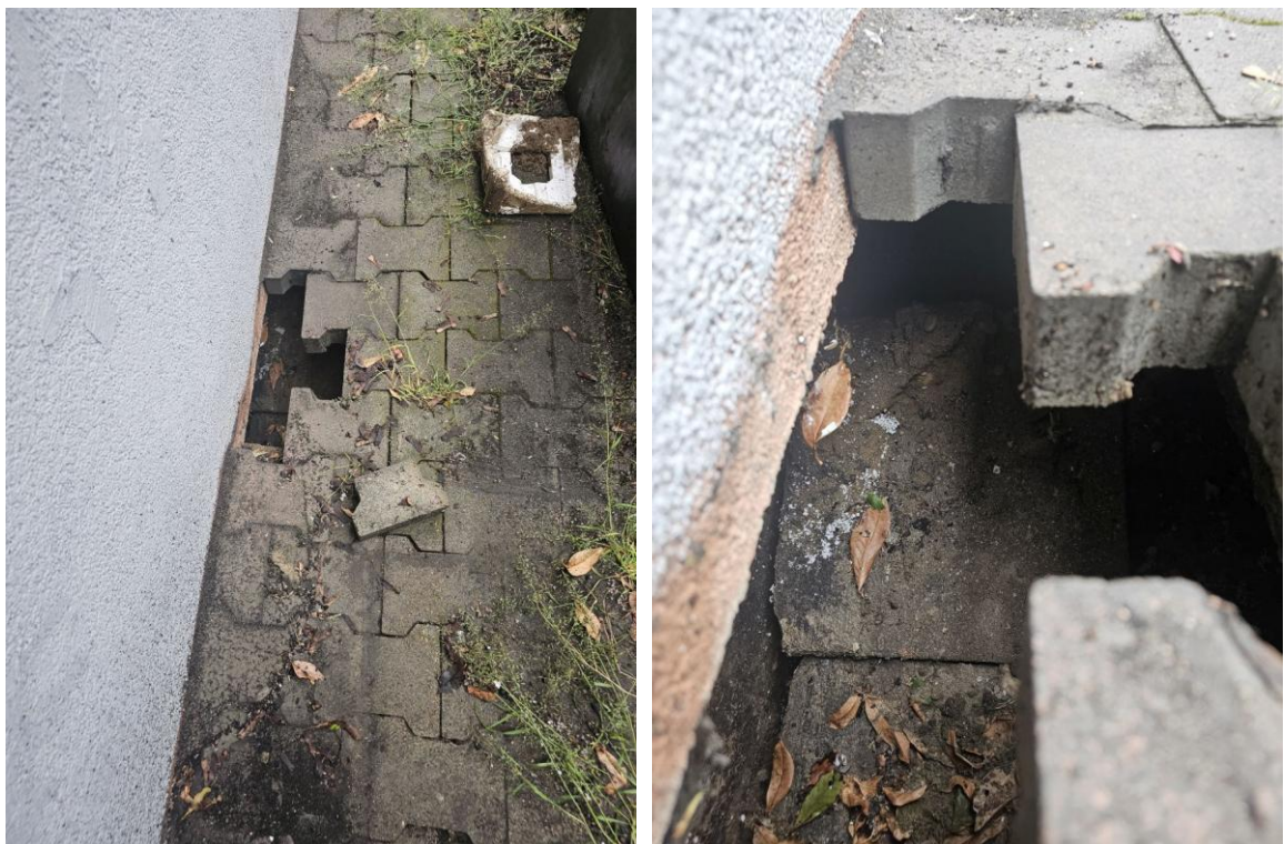
Fot. 1, 2 – Uszkodzony chodnik.

Podczas wizji lokalnej [W1] stwierdzono, że część chodnika znajdującego się bezpośrednio przy murze jest zapadnięta. Zapadlisko swym zakresem szacuje się 1m wzdłuż budynku oraz 30cm głębokości.