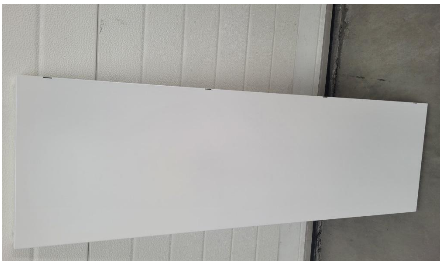
Widok półki wraz z otworami pod tylne listwy do półek