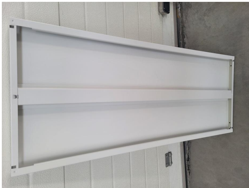
Widok wzmocnienia w półce