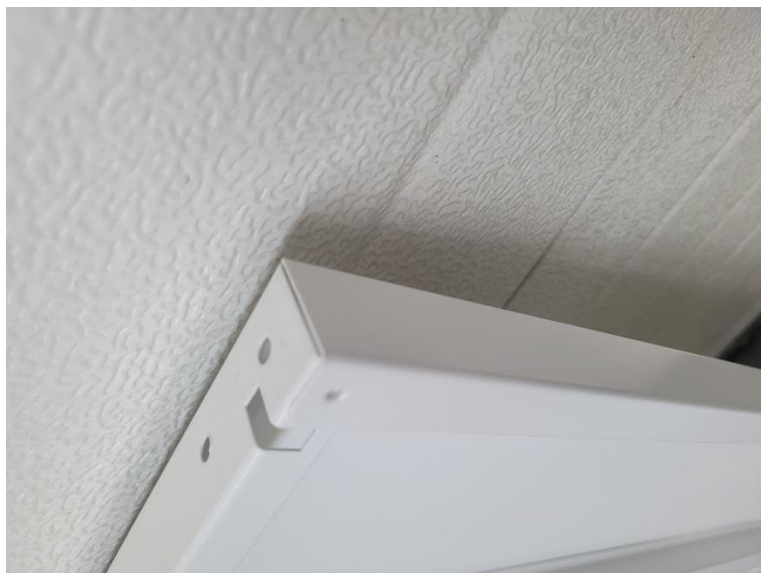
Półka spinana w narożach