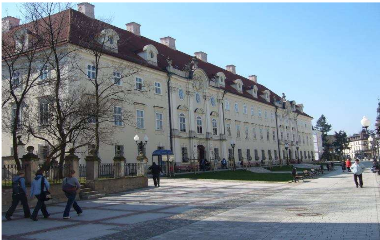
Fot. nr 1 – Budynek F2-A, Budynek Główny Filii Politechniki Wrocławskiej

Budynek F2-A pełni obecnie funkcję budynku głównego Filii Politechniki Wrocławskiej. Gmach został wybudowany w latach 1784-1809 jako Pałac Schaffgotschów zaprojektowany przez Johanna Georga Rudolfa, mistrza budowlanego. Obiekt został zaprojektowany w stylu dojrzałego baroku z formami wczesnoklasycystycznymi.