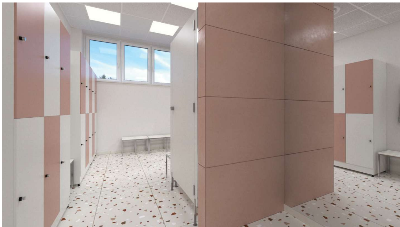
Widok na wnętrze szatni damskiej

Po przekroczeniu progu szatni wchodzimy w przestrzeń, która już na pierwszy rzut oka emanuje spokojem i równowagą. Zderzenie pastelowego różu i beżu (w wersji damskiej) lub chłodnego błękitu i kości słoniowej (w wersji męskiej) tworzy subtelną grę kontrastów. To kolorystyczne odbicie idei Yin–Yang.