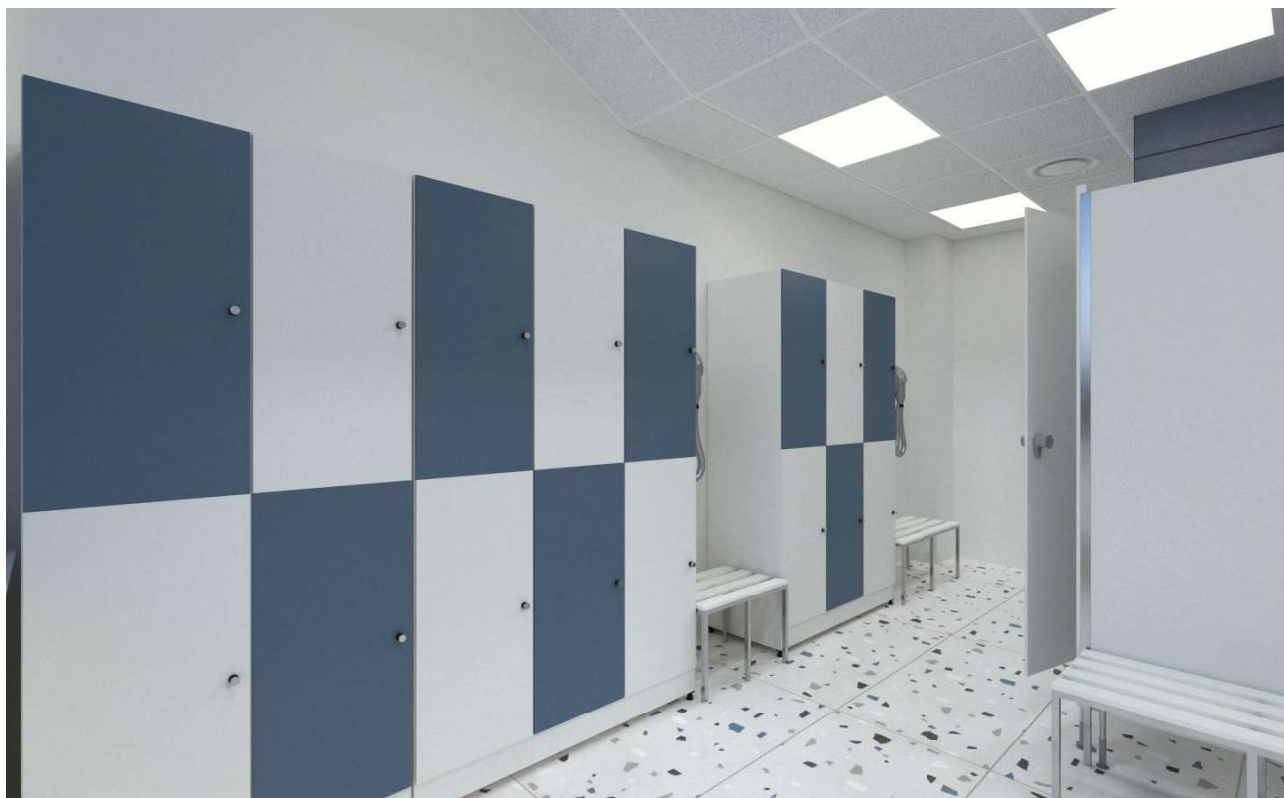
Widok na wnętrze szatni męskiej