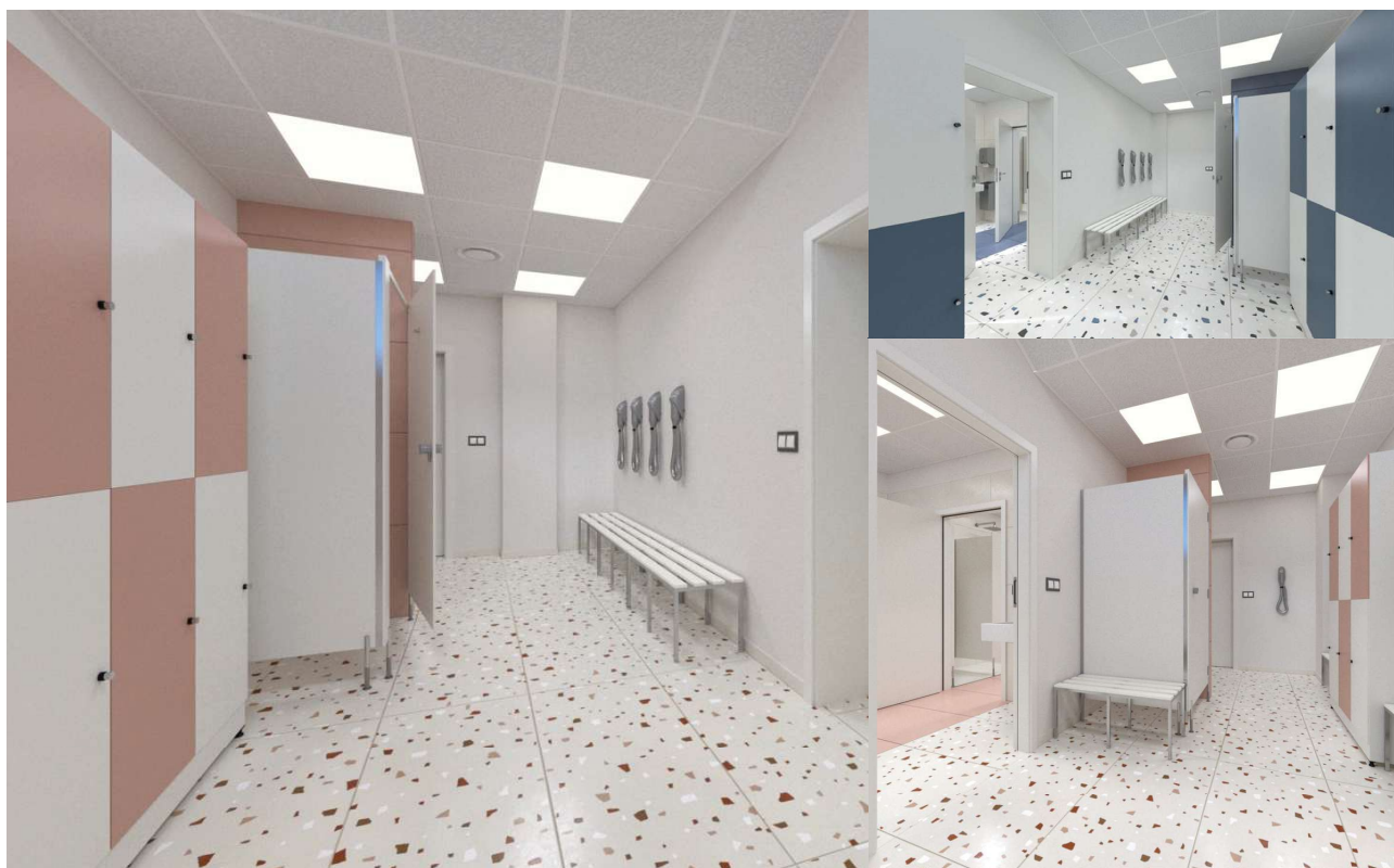
Szatnie męskie i damskie urządzone są wg dwóch układów w lustrzanym odbiciu.