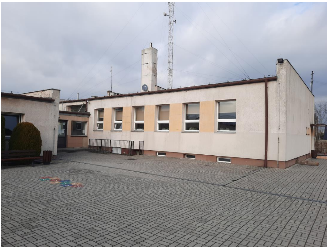
Zdjęcie 8. Elewacja południowo wschodnia III