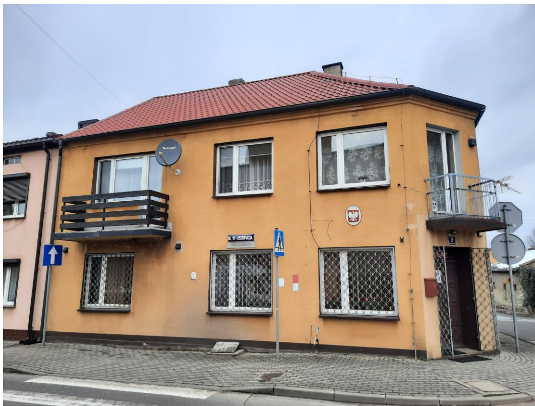
Zdjęcie 1. Elewacja południowa