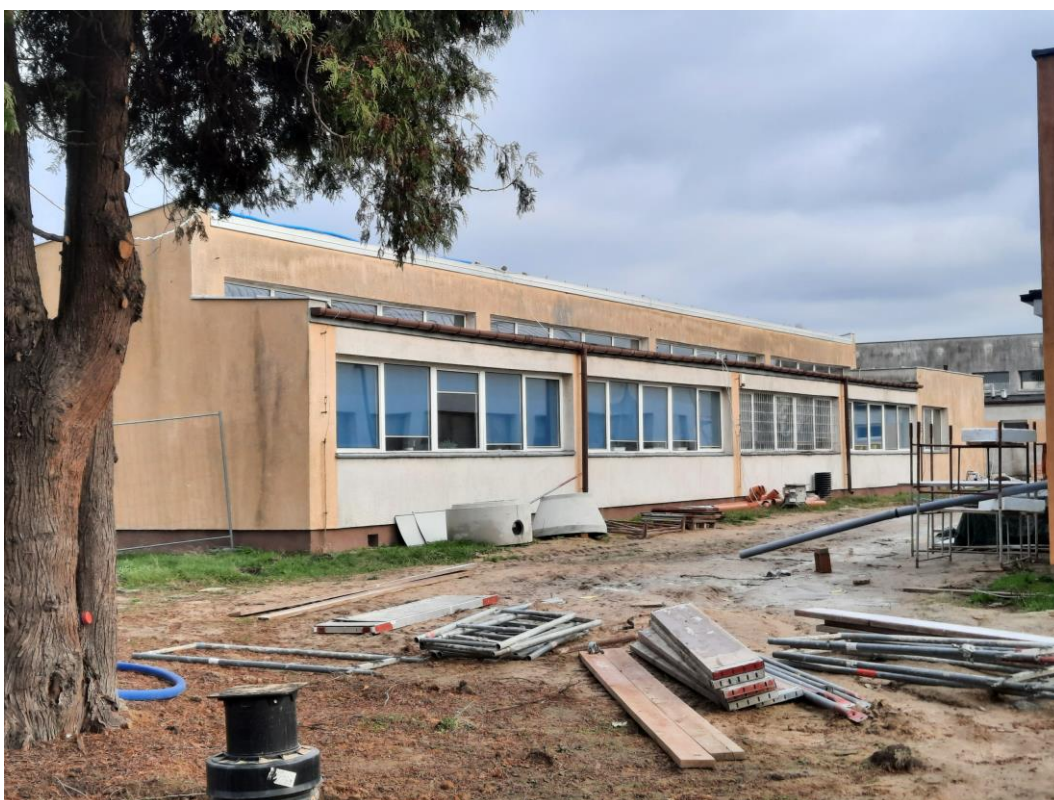
Zdjęcie 13. Elewacja południowo zachodnia