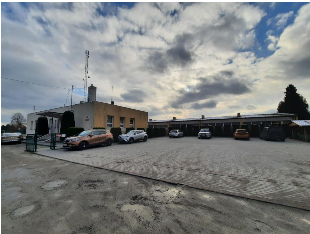
Zdjęcie 10. Elewacja północno wschodnia