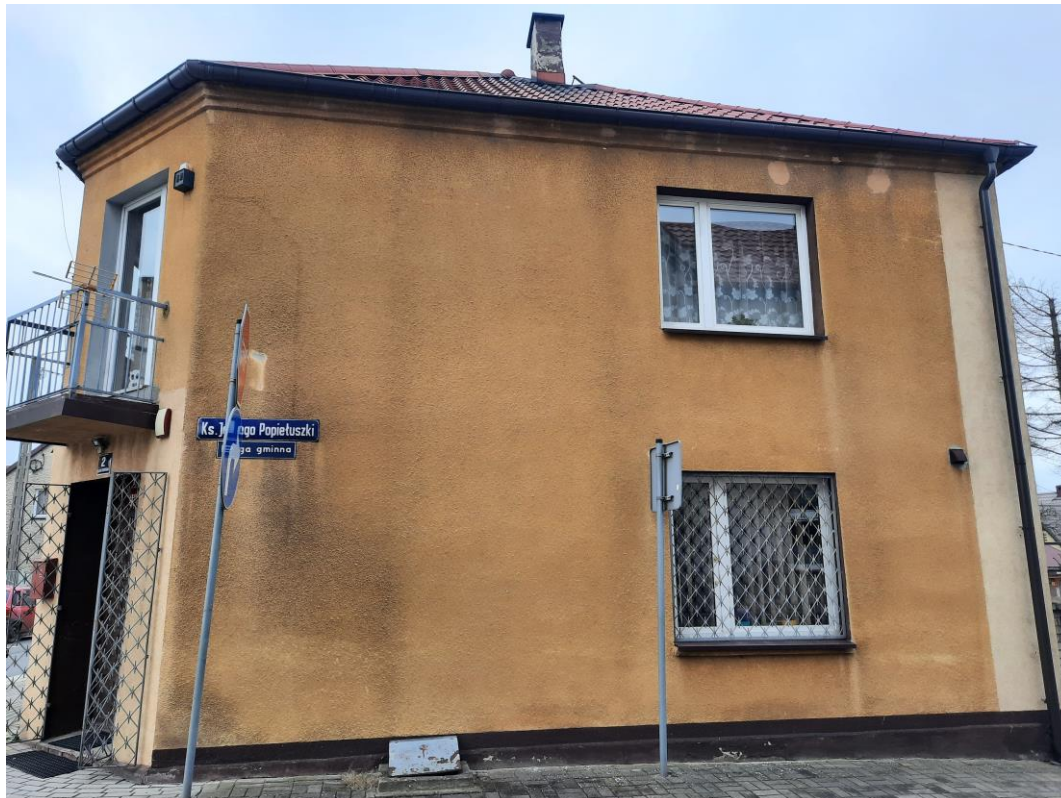
Zdjęcie 2. Elewacja wschodnia