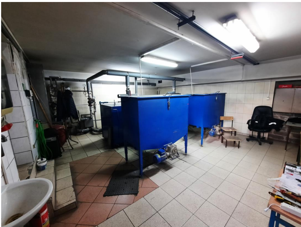
Zdjęcie 16. Kociołnia – istniejące kotły na pellet