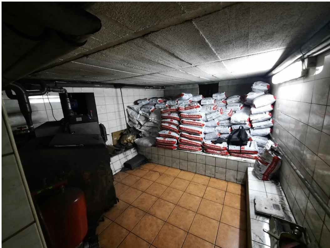
Zdjęcie 4. Kotłownia I