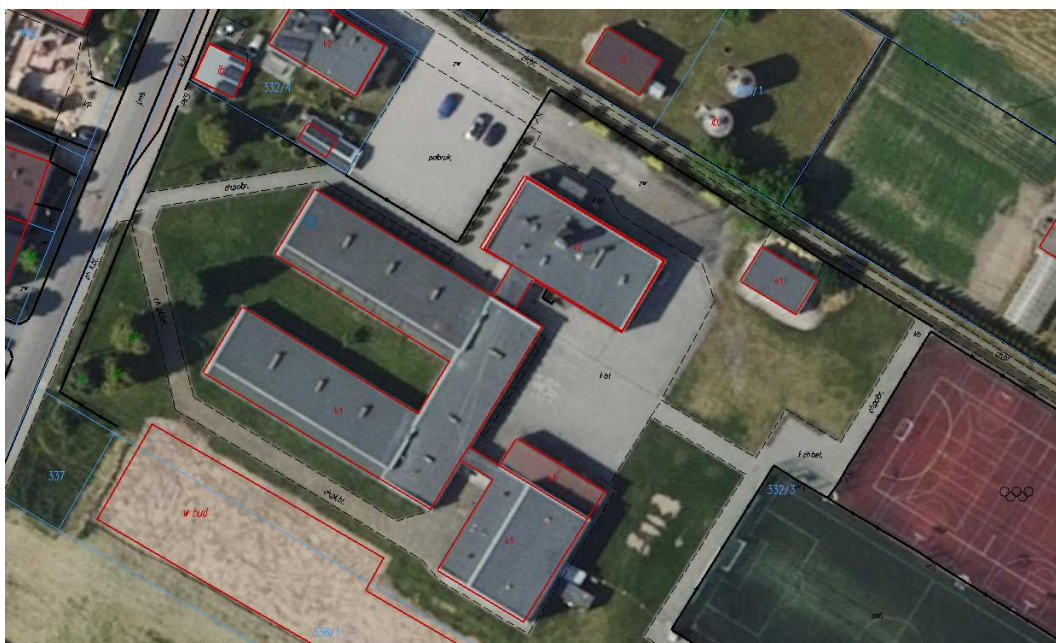
Rysunek 2. Lokalizacja obiektu Biblioteki Publicznej w Bolesławcu Budynek zlokalizowany na dz. nr 196 obręb geodezyjny Bolesławiec