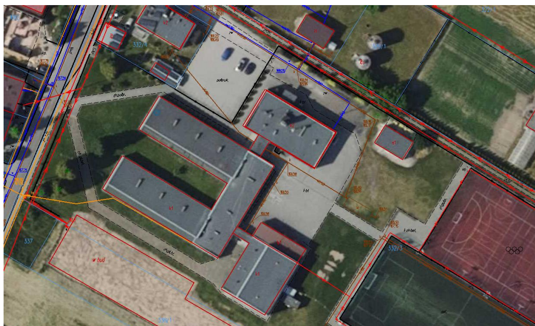
Rysunek 4. Lokalizacja budynku Biblioteki Publicznej w Bolesławcu wraz z przyłączami