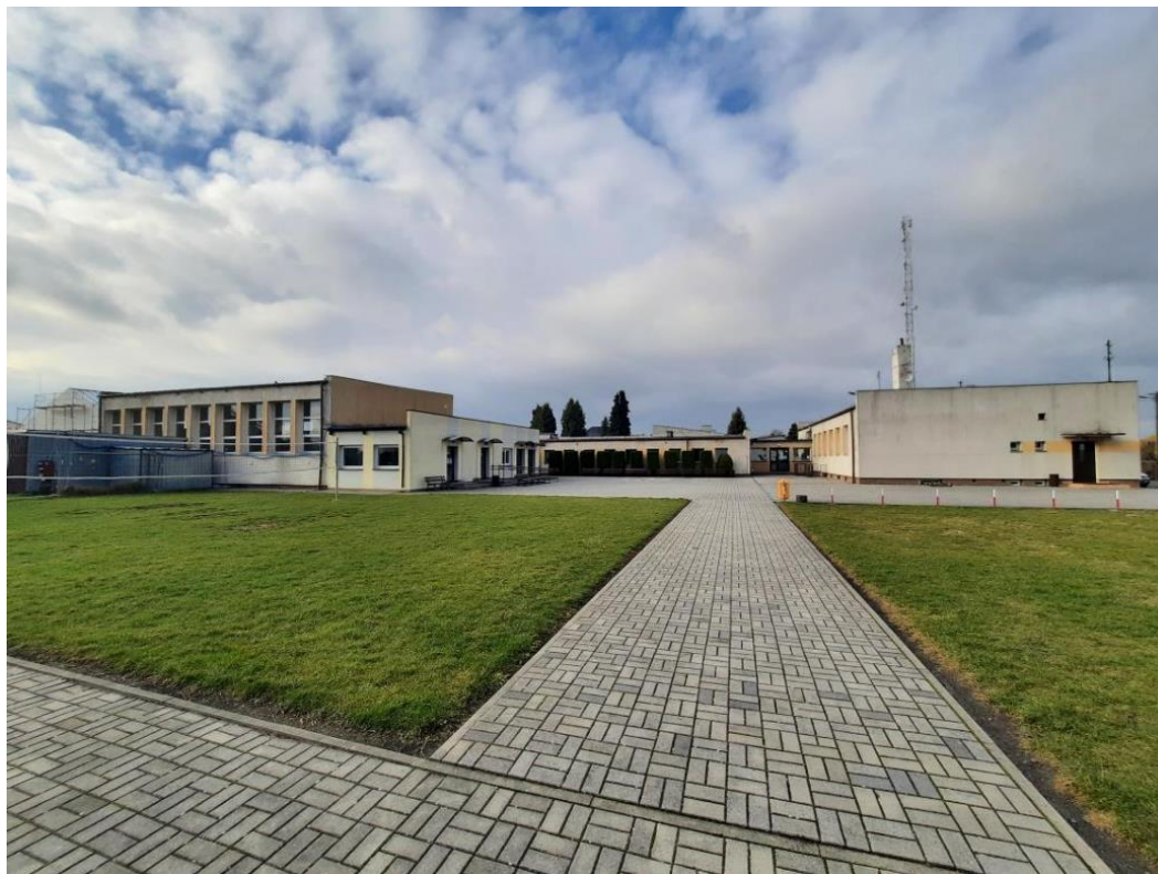
Zdjęcie 6. Elewacja południowo wschodnia I