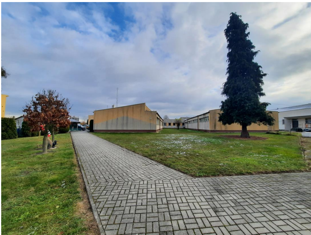
Zdjęcie 12. Elewacja północno zachodnia I