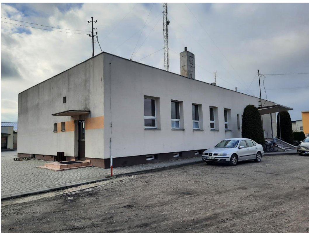
Zdjęcie 9. Elewacja północno wschodnia