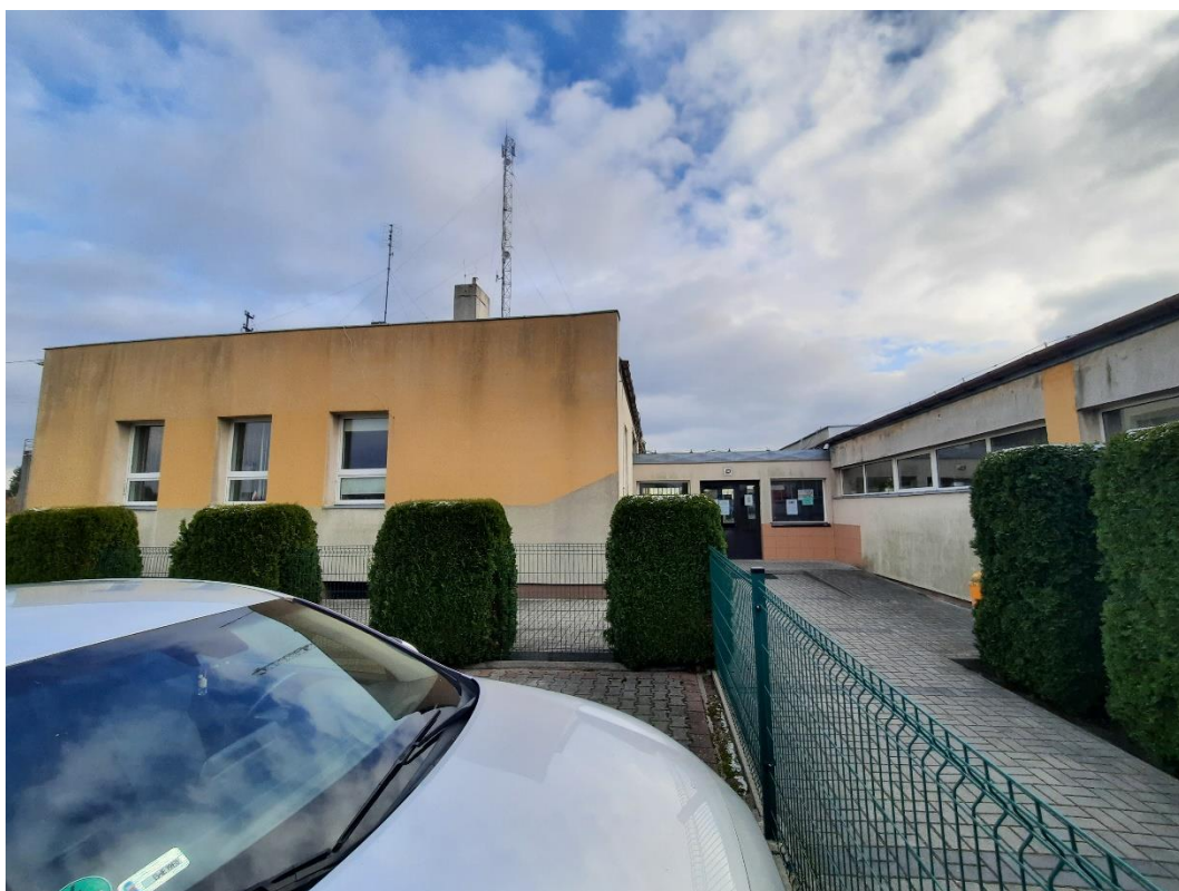
Zdjęcie 11. Elewacja północno zachodnia I