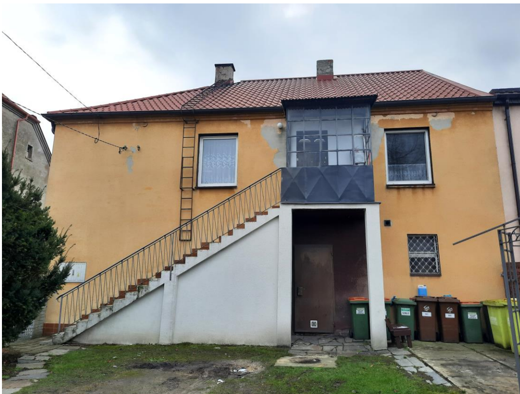
Zdjęcie 3. Elewacja północna