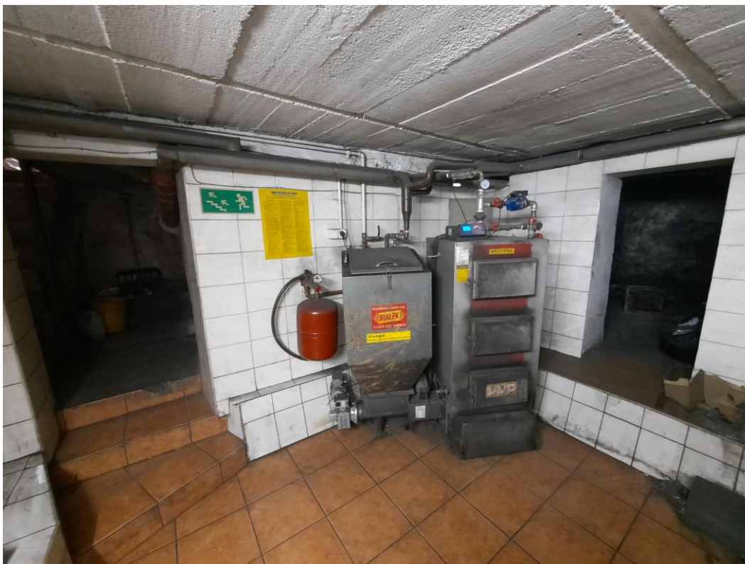
Zdjęcie 5. Kotłownia II