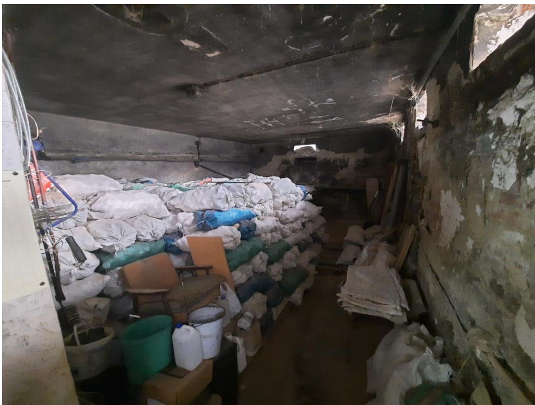
Zdjęcie 17. Skład opału