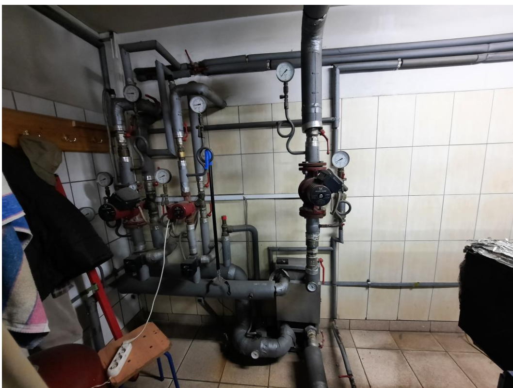
Zdjęcie 15. Kotłownia – układ hydrauliczny