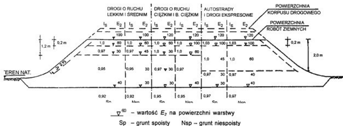
Rys. 1. Wartości wymagane w nasypach: wskaźnika zagęszczenia I_s i wtórnego modułu odkształcenia E_2 , wg [1].

Jako zastępcze kryterium oceny wymaganego zagęszczenia gruntów dla których trudne jest określenie wskaźnika zagęszczenia I_s , przyjmuje się wartość wskaźnika odkształcenia I_0 , wyznaczanego jak określono w punkcie 1.4.3.