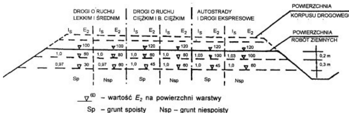
Rys. 1. Wartości wymagane w podłożu wykopów: wskaźnika zagęszczenia I_s i wtórnego modułu odkształcenia E_2 [1].

Zagęszczenie gruntu w wykopach - w podłożu wykopu, określane jest na podstawie: