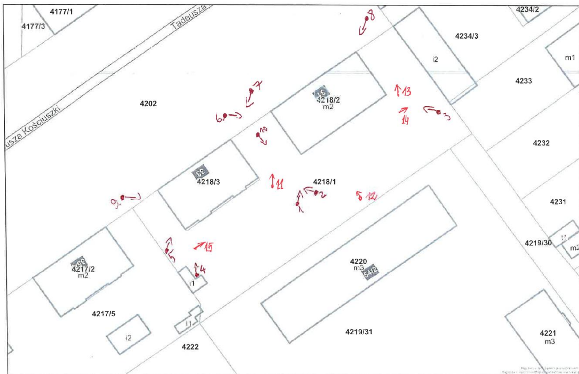
Rys. 3 Lokalizacja wykonywanych zdjęć