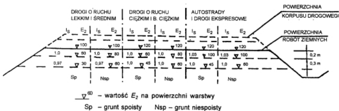
Rys. 1. Wartości wymagane w podłożu wykopów: wskaźnika zagęszczenia I s i wtórnego modułu odkształcenia E 2 [1].

Zagęszczenie gruntu w wykopach - w podłożu wykopu, określane jest na podstawie: