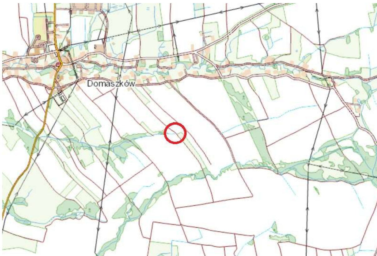
Rys. 2 – mapa poglądowa