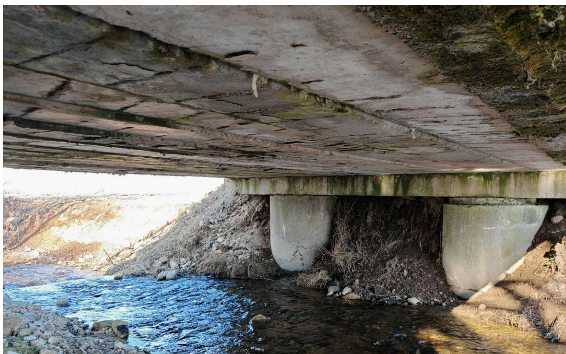
Fot. 1 – Most nad ciekiem Nowinka, widok przezsło i przyczółek od strony północnej