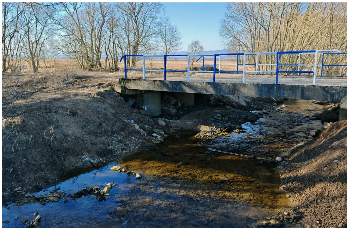
Fot. 2 – Most nad ciekiem Nowinka, widok na stronę wschodnią obiektu