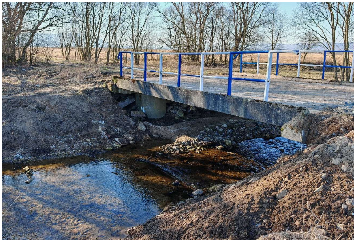
Fot. 1 – Most nad ciekim Nowinka, widok na stronę wschodnią obiektu

Każdy z przyczółków stanowi dwa filary z kręgów betonowych wypełnionych nieznany materiał prawdopodobnie kruszywem lub chudym betonem. Kręgi posiadają pęknięcia i uszkodzenia spowodowane prawdopodobnie uderzeniem przedmiotów oraz kamieni i głazów niesionych przez ciek w trakcie powodzi w 2024 roku. W wyniku działania żywiołu zostały również zniszczone dojazdy do obiektu. W stanie istniejącym wykonano prowizoryczne i tymczasowe roboty umożliwiające przejazd przez obiekt. Przęsło wykazuje przesunięcie względem pierwotnego położenia.