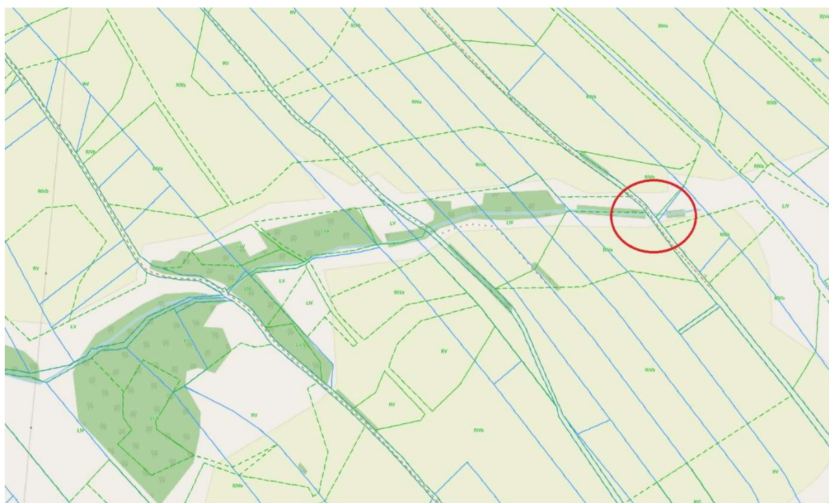
Rys. 3 – lokalizacja inwestycji [źródło: opracowanie własne ]