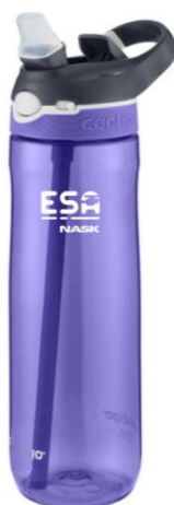
Rys. 7 Przykładowa wizualizacja