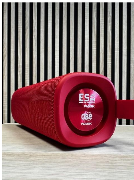
Rys. 6 Przykładowa wizualizacja