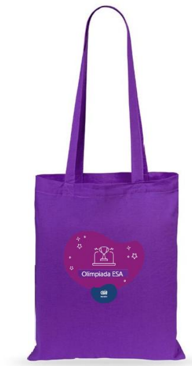
Rys. 1 Przykładowa wizualizacja