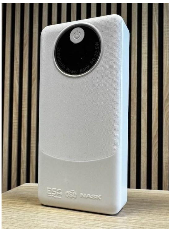
Rys. 4 Przykładowa wizualizacja