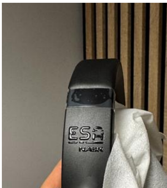
Rys. 5 Przykładowa wizualizacja