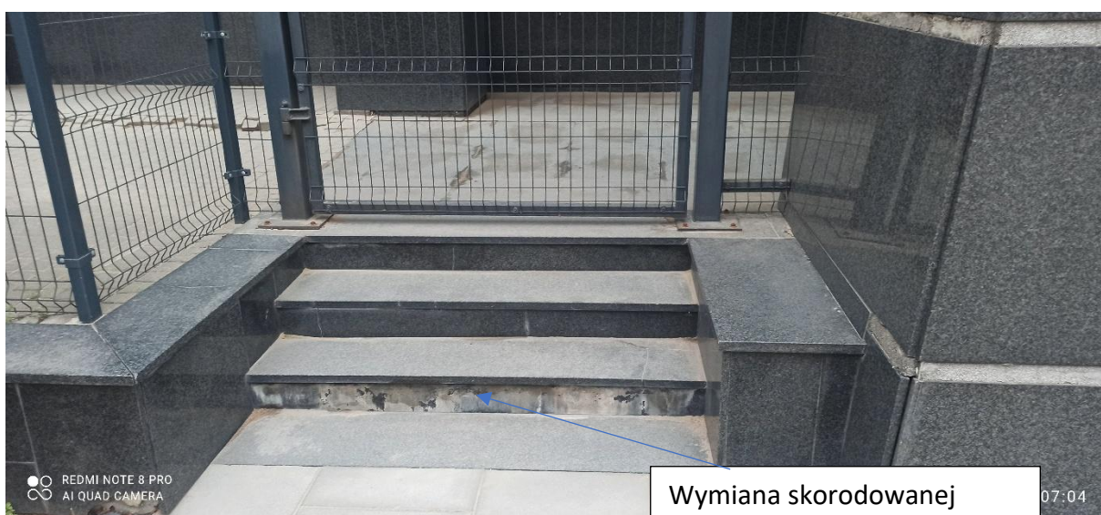
Wymiana skorodowanej podstopnicy w lewym biegu schodów