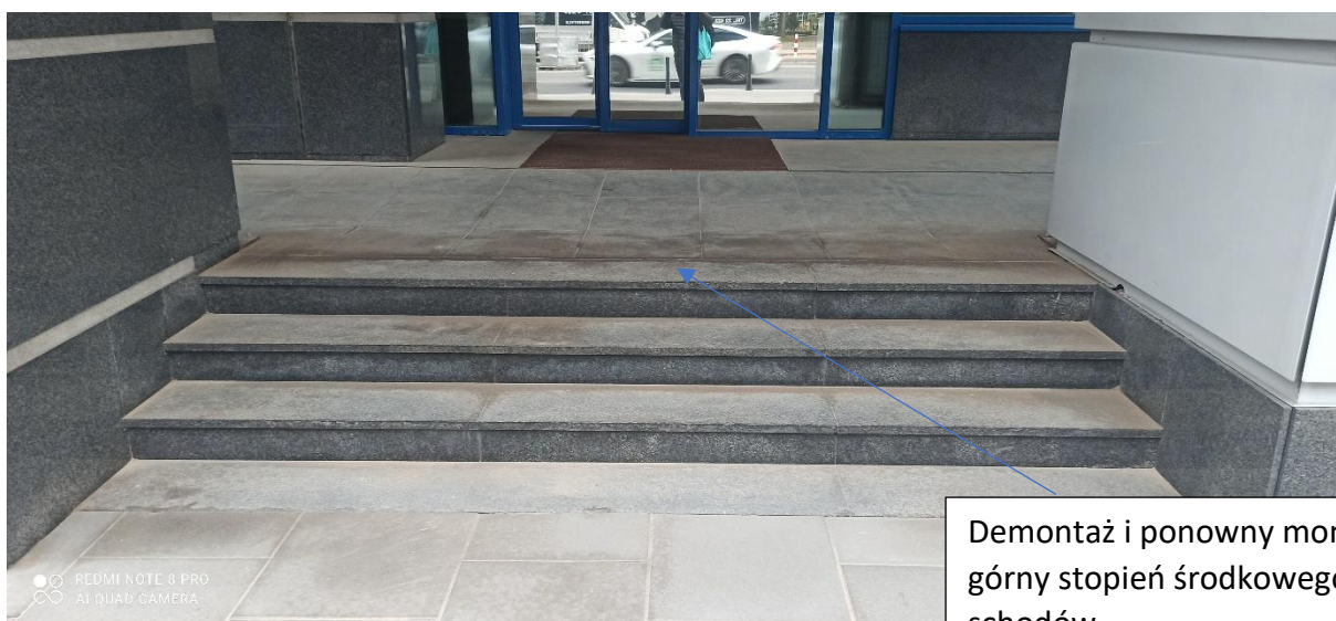
Demontaż i ponowny montaż - górny stopień środkowego biegu schodów