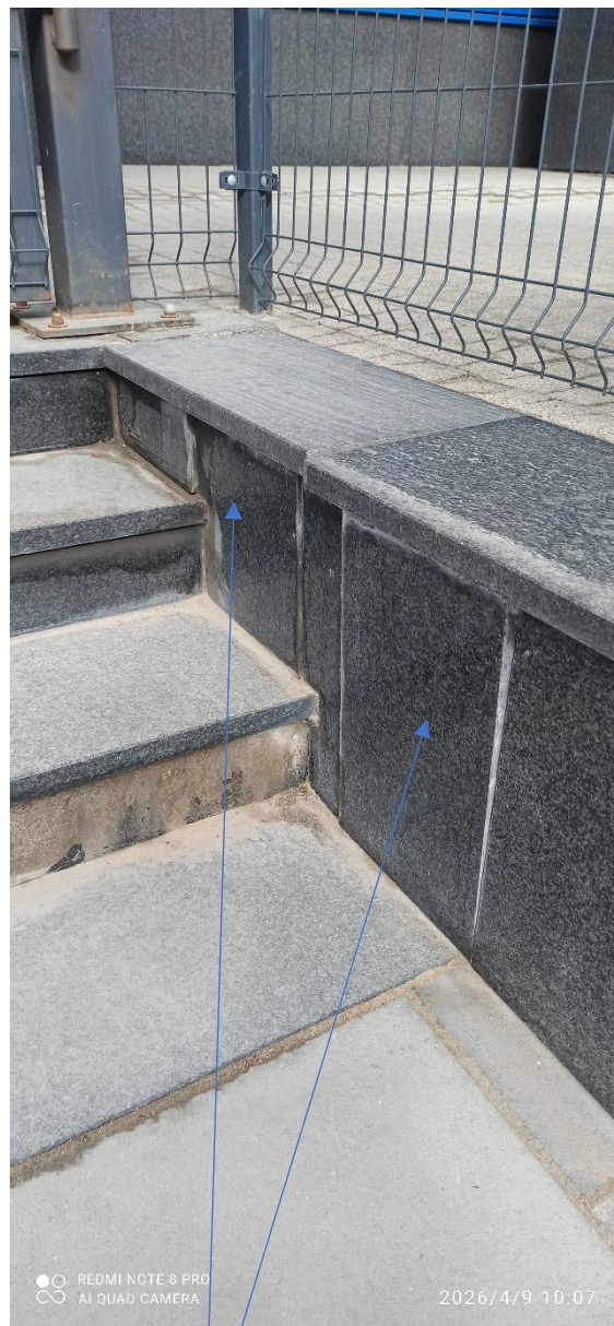
Demontaż i ponowny montaż - elementy okładziny kamiennej na murku oporowym przy prawym biegu schodów