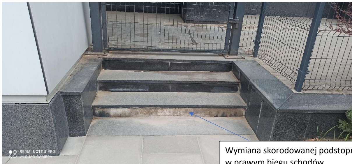
Wymiana skorodowanej podstopnicy w prawym biegu schodów