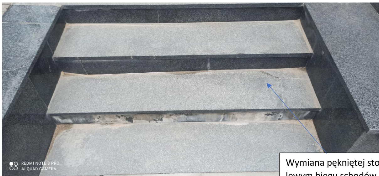
Wymiana pękniętej stopnicy w lewym biegu schodów