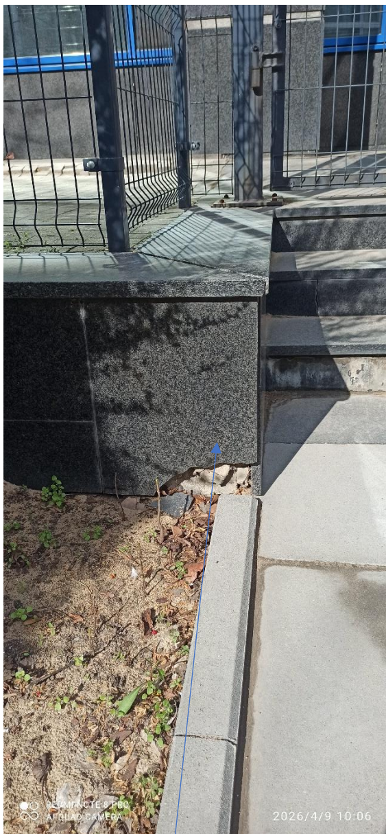
wymiana uszkodzonego elementu okładziny kamiennej murka oporowego