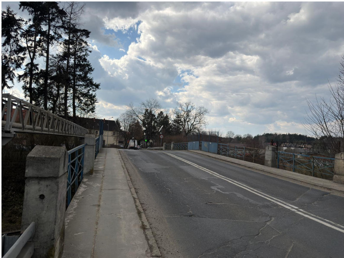
Fot. 2 i 3 – widok na obiekt od strony wschodniej; widok na nawierzchnię jezdní