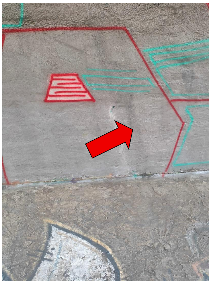
Fot. 6 i 7 – widok na podpory – widoczne uszkodzenia i zarysowania