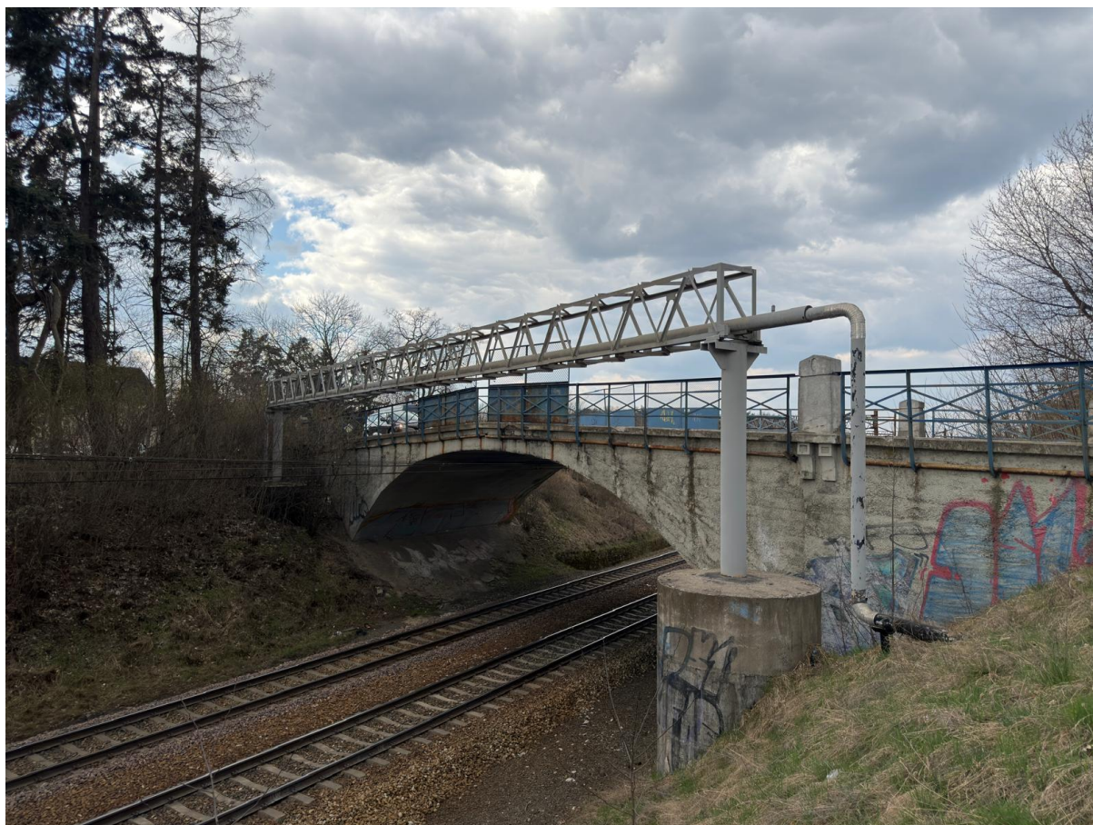
Fot. 1 – widok na obiekt od strony wschodniej