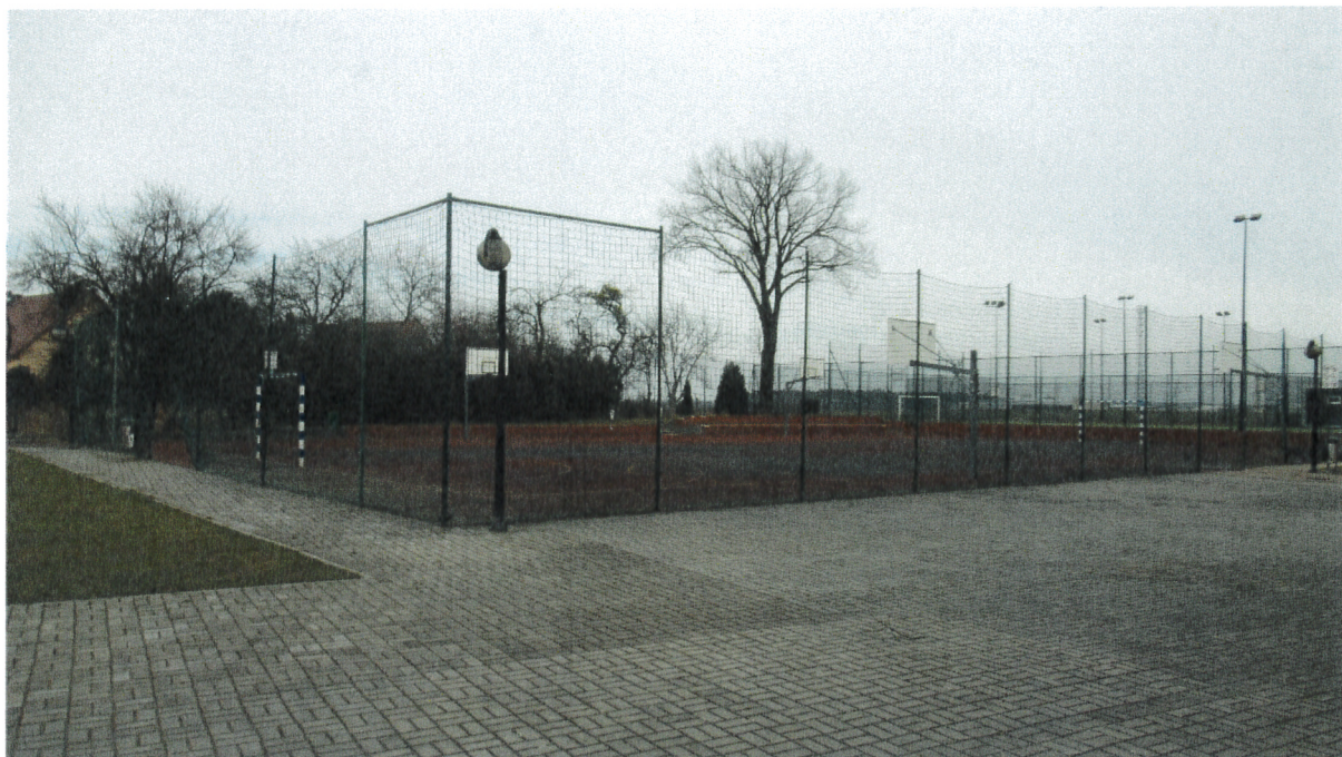
BOISKO WIELOFUNKCYJNE (przyległe do kompleksu ORLIK)