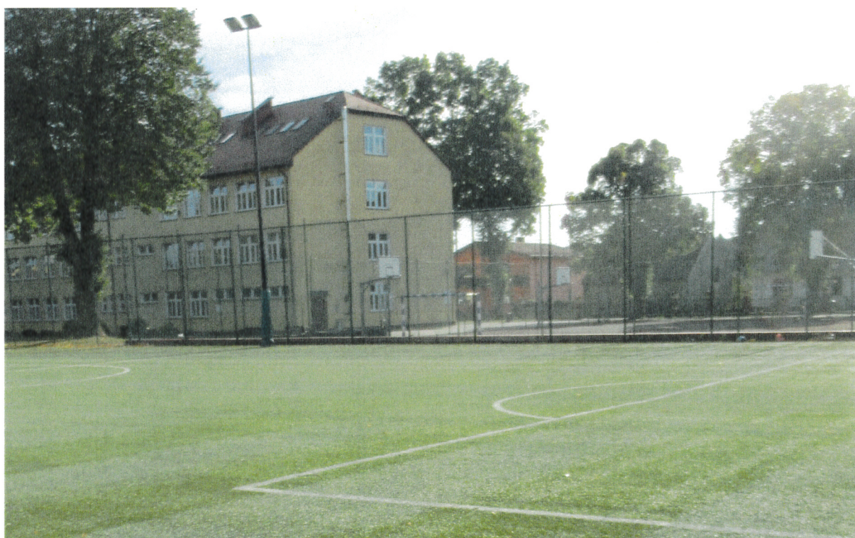
BOISKO PIŁKARSKIE Z TRAWY SYNTETYCZNEJ (kompleks ORLIK)